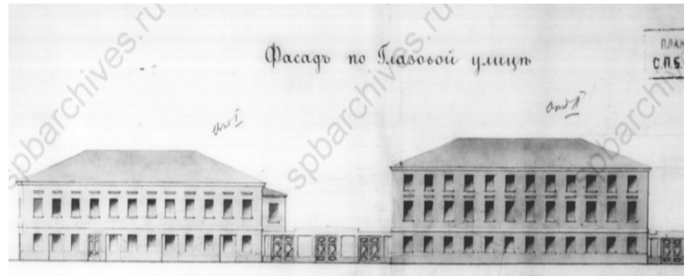
Константина Заслонова ул., 8. ЦГИА СПб ф.515 оп.4 д.474.

Два каменных дома на углу улиц Глазовской и Средней (нынешняя Воронежская) впервые упоминаются в 1826 году, их