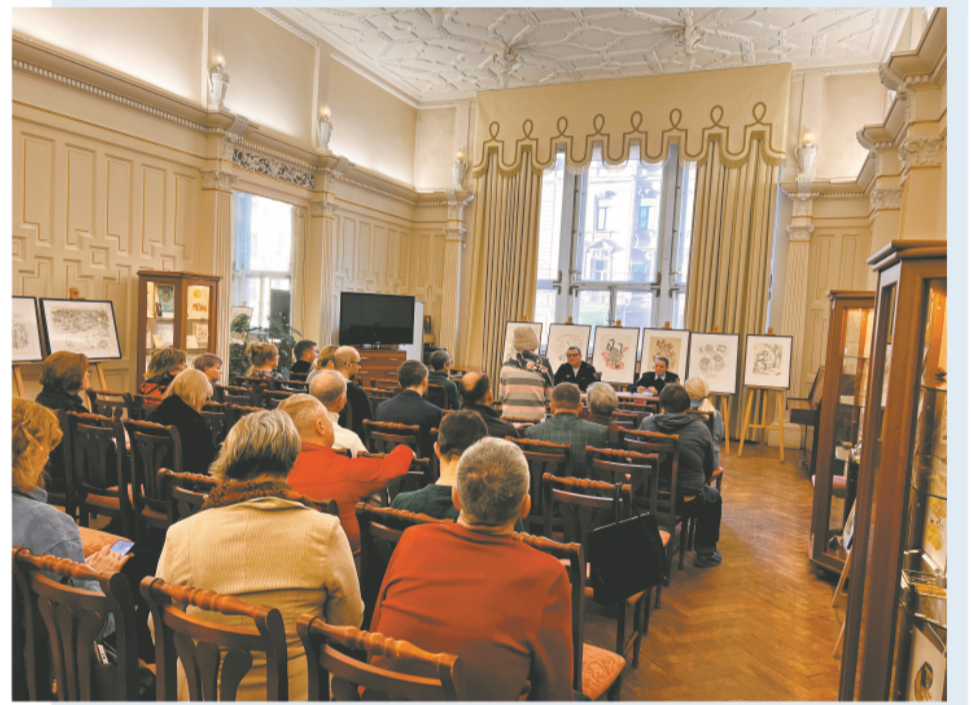
Жители в большей степени относятся с пониманием к непростой работе полиции