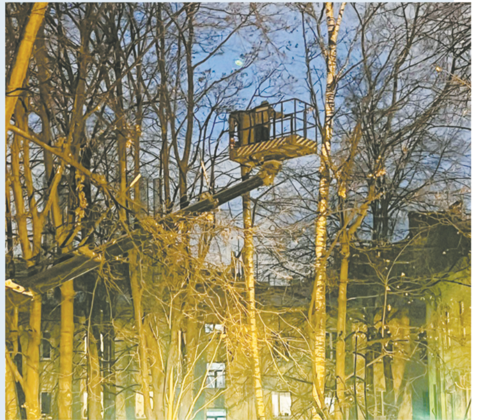
Обрезка сухих веток, прореживание кроны

В силу все той же хрупкости стволы этих деревьев подвержены образованию дупел. Часто дупла образуются в корневой шейке дерева. И тут начинаются работы по удалению здорового с виду дерева. Но здоровое оно только на первый взгляд. Представьте, на месте стыка дерева с землей - пустота. Так было с тополем у дома 83 на Обводном канале. С пушистой кроной и яркой листвой, он давал приятную тень и украшал двор, и вдруг стал не мил. Проходящие мимо жители удивляются: зачем вам понадобилось здоровое дерево? Но если кора хорошая, дерево сможет получать питание по коре и будет показывать листву. Однако несущей способности у такого дерева не будет. При чуть более сильном ветре дерево обрушится. Для этого конкретного тополя на Обводном канале высчитали по формуле с учетом диаметра ствола и высоты дерева фитомассу. Почти 10 тонн! Такое же дерево с большим дуплом на ул. Ломоносова, 18 имеет фитомассу 8,3 тонны, на ул. Стремянной, д. 14 тополь с дуплом в прикорневой шейке с диаметром ствола до 88 см - почти 11 тонн. Можете предста-