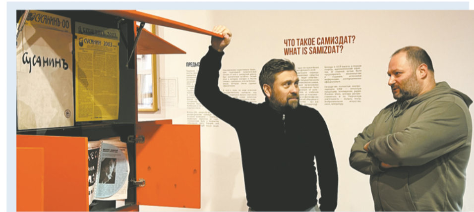
Основная задача центра - создавать и презентовать современное искусство

та и вел переговоры с Собчаком об арт-центре. Был найден инвестор, который делал ремонт, была договоренность с городом - большая часть дома отходила под жилой фонд, а 2 парадные на фасаде и 2 флигеля достались гуманитарному фонду «Свободная культура», который к тому моменту организовали указанные художники. Сквотов было много – с десяток только крупных, только наш сохранился. В округе, кстати, возник один из первых сквотов - на Лиговском, 127 в конце 70-х гг. второй этаж нежилого здания занимала художественная группа «Алипий». Мне кажется, «Пушкинская» сохранилась благодаря тому, что сюда попали люди из ТЭИИ, которые имели опыт руководства и борьбы. Они не тусовались, а строили.