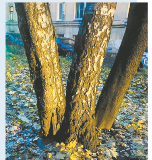
Поражение прикорневой части ствола

вить последствия, если эта масса обрушится?