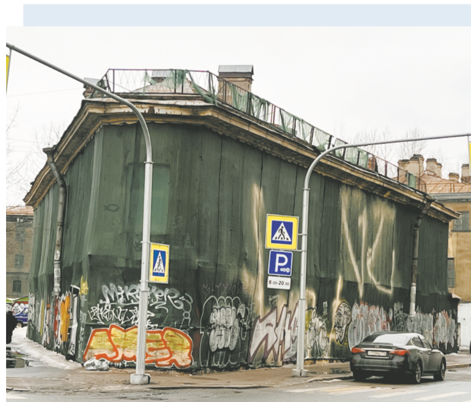
ул. Константина Заслонова, 8

Какая судьба ждет это здание дальше, мы узнаем совсем скоро, а пока вспомним, что здесь мог бы открыться дом культуры Владимирского округа. Передача памятника культуры в руки муниципалитета выглядела бы как наиболее верный путь к его сохранению. На момент обращения бюджет муниципалитета позволял в течение нескольких лет провести работы по реставрации здания, но, к большому сожалению, проект не состоялся. Время работает против нашей истории, мешает сохранению культурного наследия города и округа. Хочется надеяться, что у дома появится добросовестный собственник, который проведет его грамотную реставрацию, и славная история дома Степанова продолжится достойным образом.