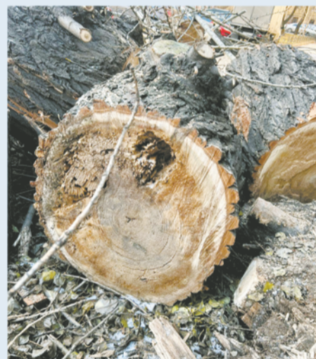
Поражение внутренней части ствола