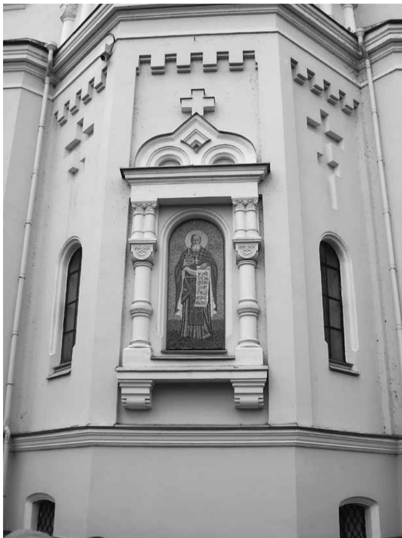
Собор Владимирской иконы Божией Матери