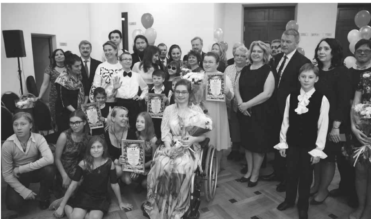
15 ноября в Государственном академическом театре им. Ленсовета (Владимирский пр., д. 15) прошёл бал для детей с ограниченными возможностями.