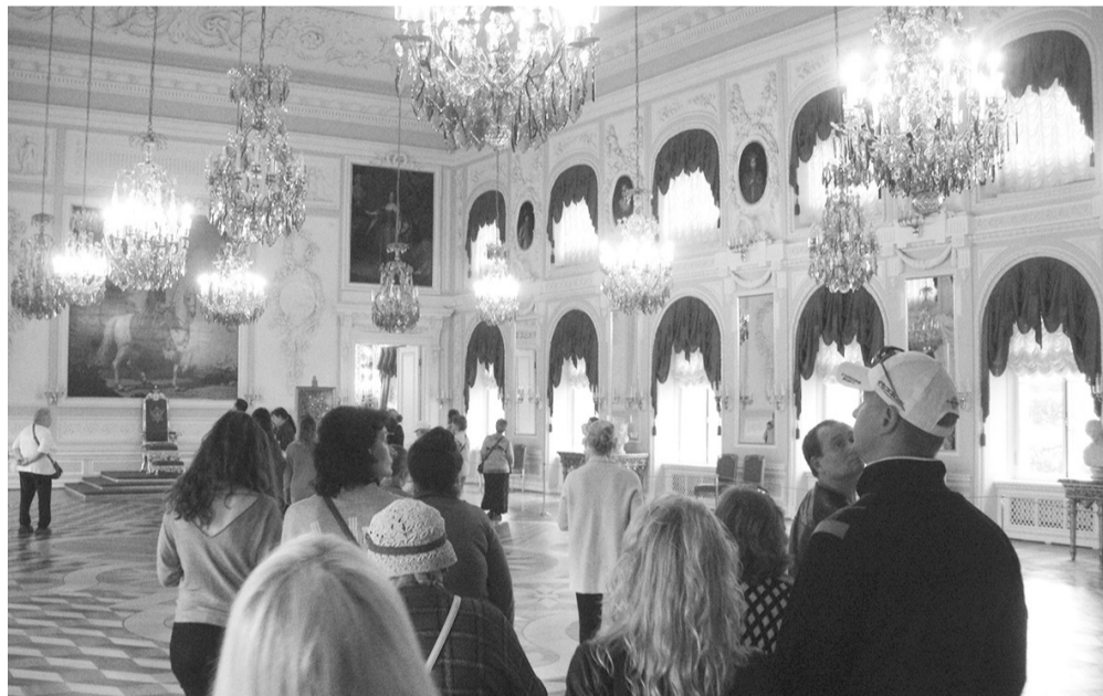
В Тронном зале Большого дворца в Петергофе