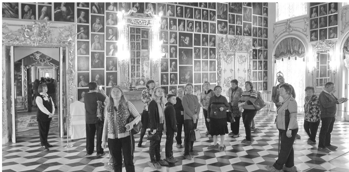
Картинный зал Большого дворца (Петергоф)

Так, Чесменский зал благодаря Екатерине II увековечил героические события флота России, одержавшего победы в Русско-турецкой войне 1768-1774 годов, отражённые в двенадцати картинах немецкого художника Якоба Филиппа Хаккерта.