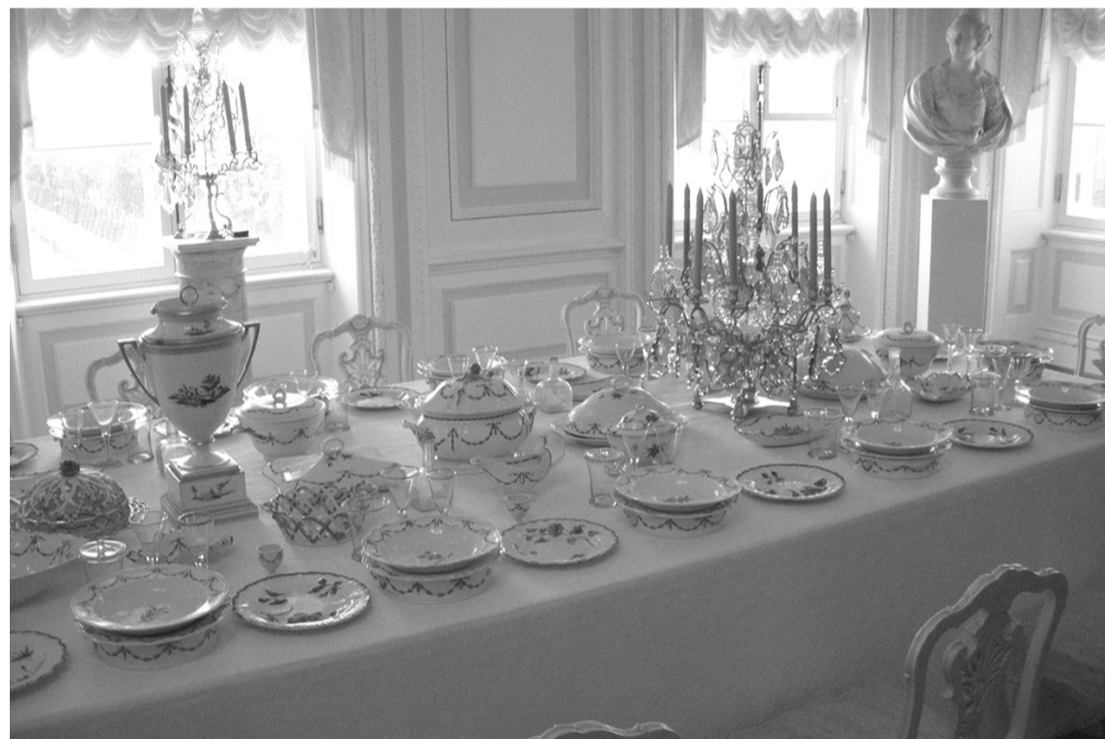
Белая столовая в Большом дворце Петергофа