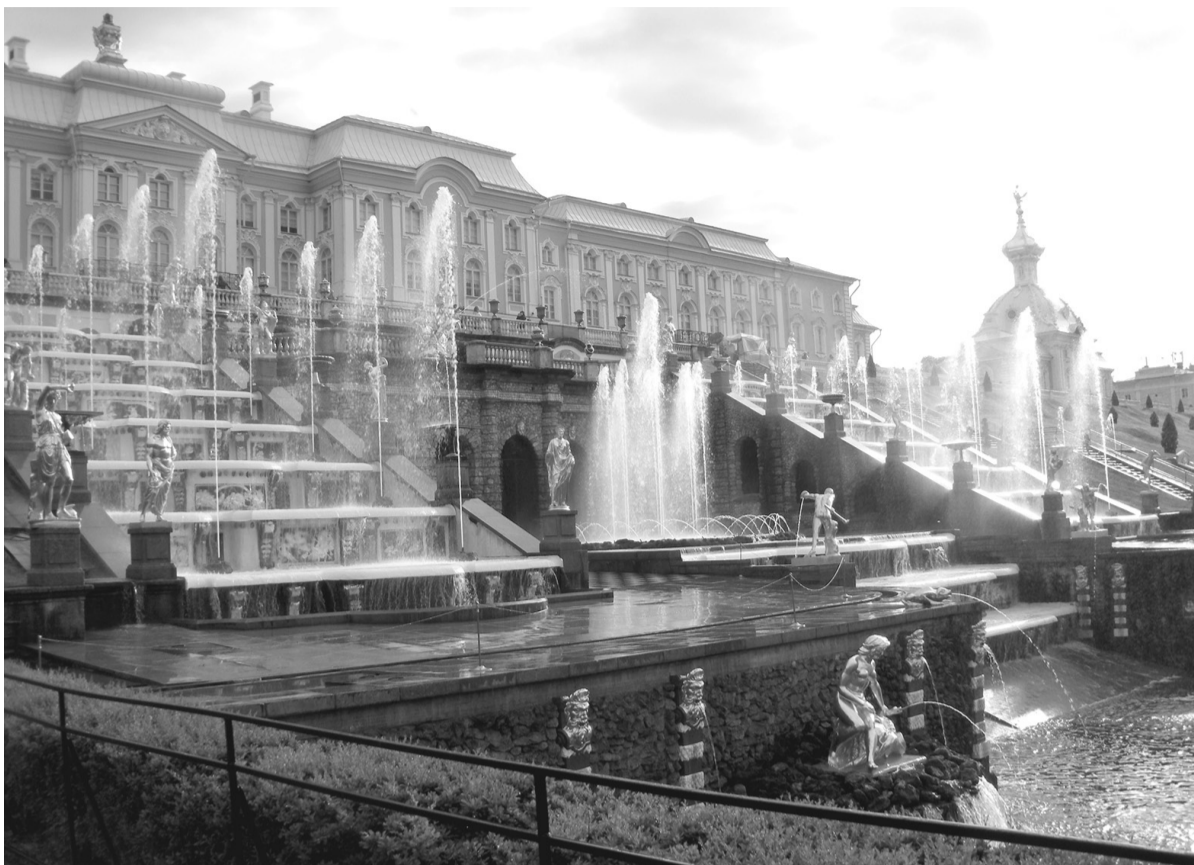
Вид на Большой дворец из Нижнего парка (Петергоф)

Это дворцово-парковое великолепие, оставленное нам в наследство царствующей династией Романовых, не может не поражать. По задумке Петра I не только место его отдыха во дворце в Стрельне, Петергоф с его великолепным парком и Большим дворцом, но и дорога, ведущая к ним, должна поражать зарубежные посольства, следующие с аудиенцией к царю. В ходе экскурсии и мы смогли оценить по достоинству труды петербуржцев — не только современников Петра I и его последователей, но и наших современников — архитекторов, строителей, озеленителей, которые превратили путь нашего следования в венценосный Петергоф в красивые ландшафты, сквозь зелень которых проглядывают церкви, старинные особ-