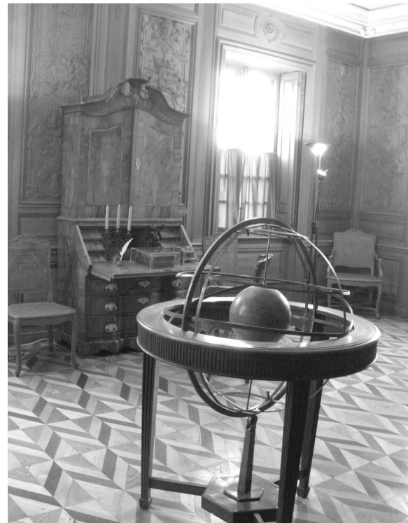
Дубовый кабинет Петра I в Большом дворце Петергофа

каждому экскурсанту для его знакомства с многочисленными залами дворца. Слова экскурсовода при этом были хорошо слышны в любой точке огромного зала в радиусе 100 метров.