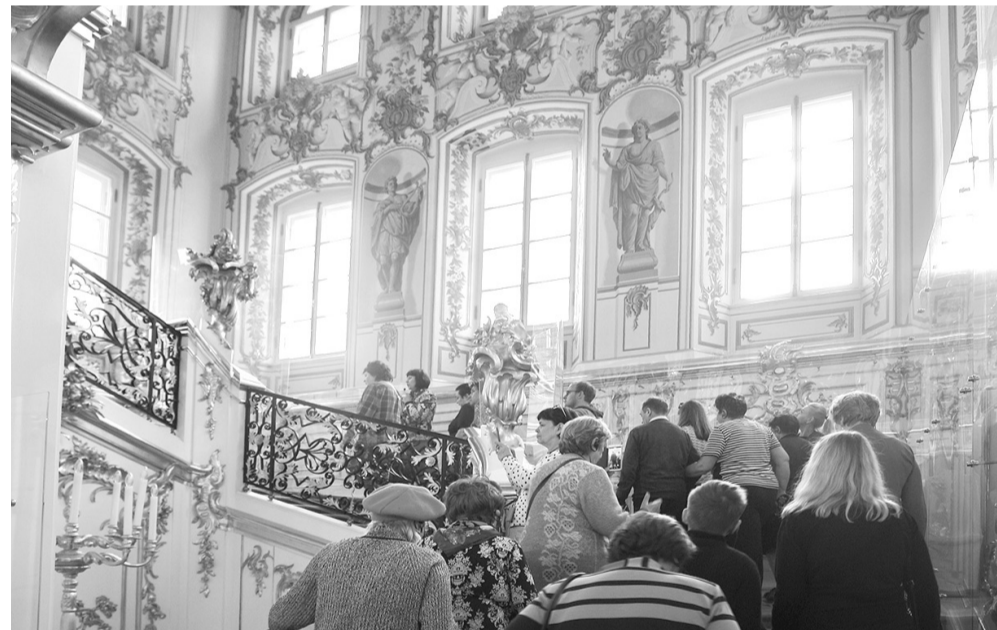
Парадная лестница Большого дворца (Петергоф)

няки, ухоженные дачи и образцы фантазии флористов.