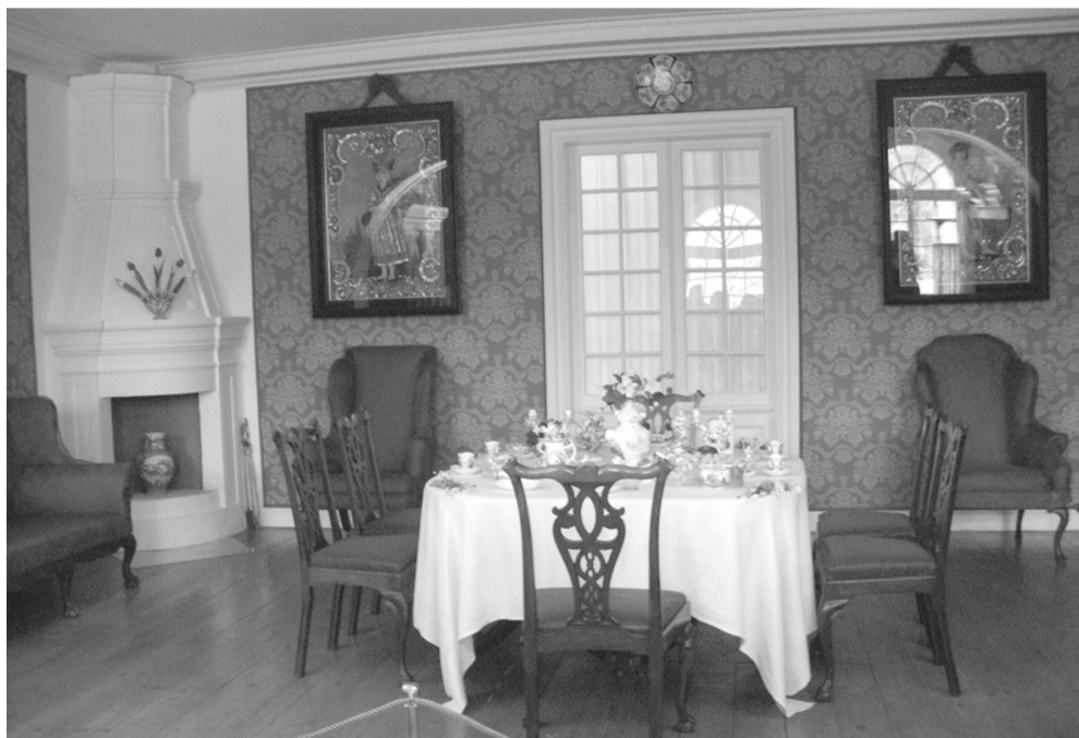
Столовая в путевом дворце Петра I (Стрельна)