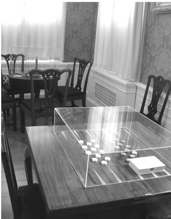
Фортунный покой путевого дворца Петра I со столами для игр (Стрельна)

Но именно фонтаны принесли мировую славу парку. Это чудо работает почти 300 лет! Первые из них были пущены в июле