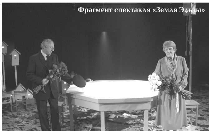
Фрагмент спектакля «Земля Эльзы»

Затем в рамках досуговых мероприятий (от 3 до 70 лет) для жителей округа прошли автобусные экскурсии с посещением Константиновского дворца в Стрельне 1 июня, а также