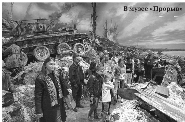
В музее «Прорыв»