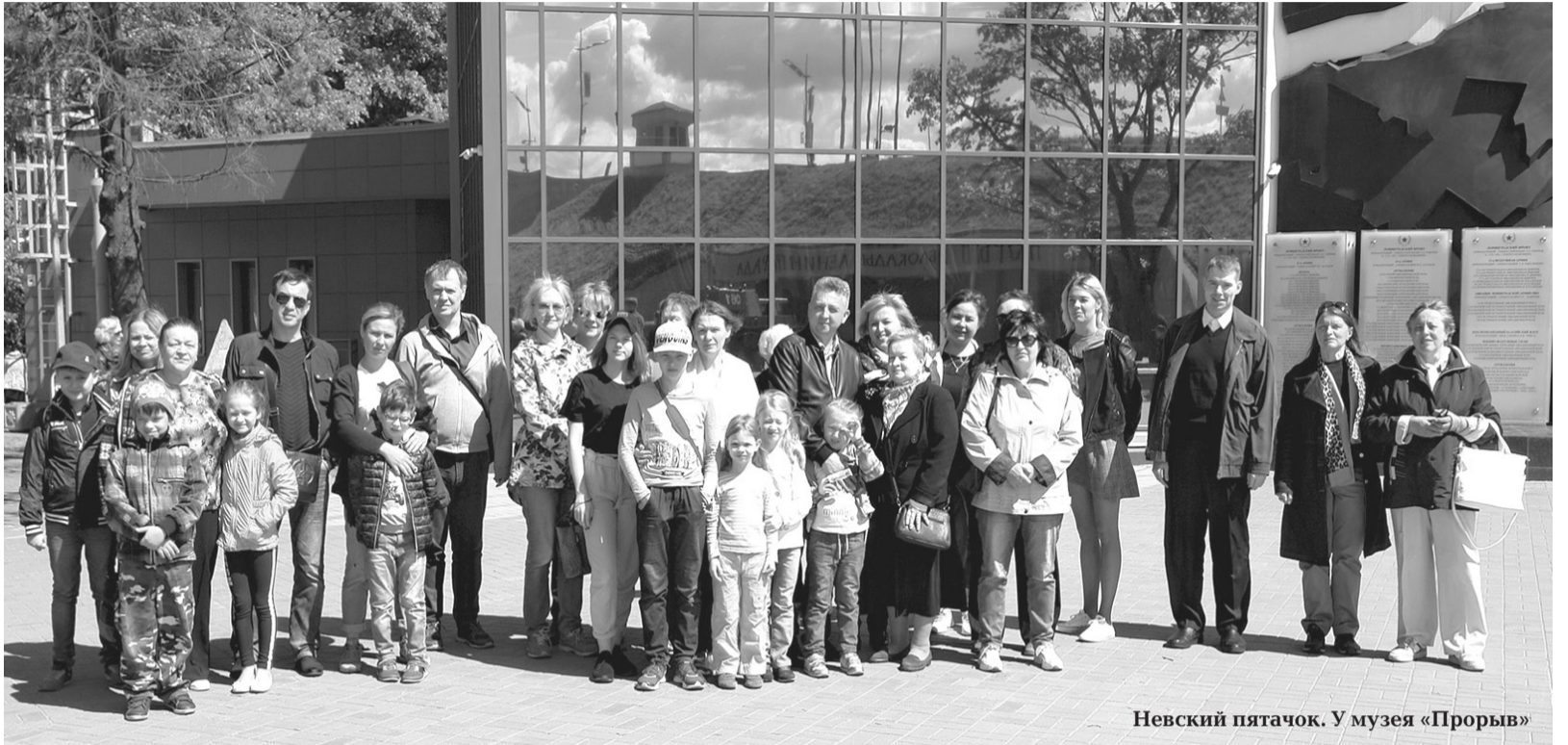
Невский пятачок. У музея «Прорыв»

Дворцы, храмы, музеи, загородные особняки, парки, спектакли в театрах и концерты в Филармонии, цирк, теплоходные экскурсии по рекам и каналам Санкт-Петербурга и Ладоге и многое другое значительно насыщает социально-культурные и эстетические запросы жителей нашего Владимирского округа. Эти мероприятия лучше помогают осмыслить масштабы созидательного труда наших земляков в Северо-Западном регионе России. Мы лучше узнаём край, в котором