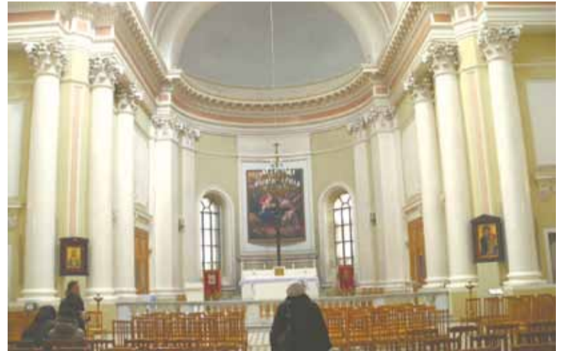
Католический приход Святой Екатерины Александрийской

В таком же строгом убранстве, без роскоши, и католический храм на Невском пр., 22-33, — Евангелическо-лютеранская церковь Святых Петра и Павла (Петрикирхе), известная петербуржцам по устройству в ней в советское время бассейну. А ещё тем, что в центре алтаря находился в своё время подлинник (сейчас копия) известной картины К. П. Брюллова «Распятие». Здесь богослужение идёт под аккомпанемент небольшого электрического органа на латинском и национальном языках. Верующие собираются по воскресеньям. У католиков и протестантов алтарь всегда открыт. Интересная деталь: распятого на кресте Христа на иконах изображают по-разному: католики — стопы ног у Христа