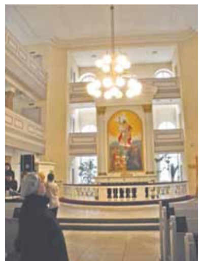
У алтаря лютеранской церкви