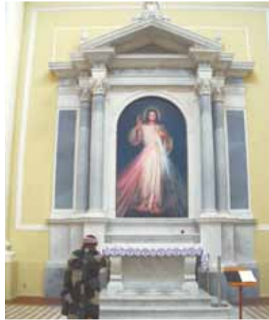
Христос в католическом приходе Святой Екатерины Александрийской

Лютеранская церковь придерживается тех же основных истин веры, что и самые крупные христианские конфессии — Католическая и Православная церкви. Верят