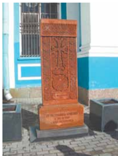
У Армянской церкви