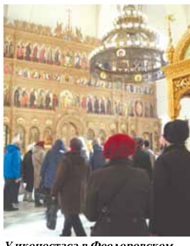
У иконостаса в Феодоровском соборе