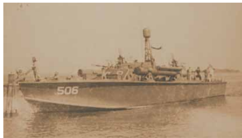
Торпедный катер «Кольт»