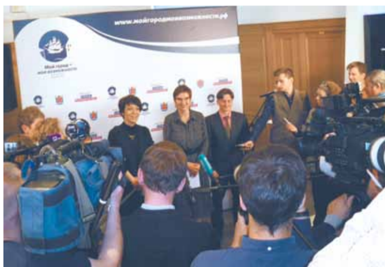
Пресс-подход для журналистов в ТАСС

Целевое назначение конкурса: пополнить кадровый резерв, помочь реализовать амбиции талантливой молодёжи, а главное — объединить активных и увлечённых людей, готовых внести вклад