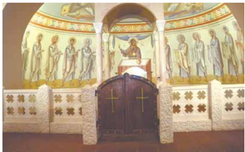
У алтаря в Феодоровском соборе