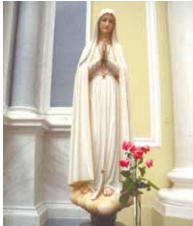
Екатерина Александрийская в католическом приходе Святой Екатерины Александрийской

Первыми наряду с православными появились в городе католическая и протестантская церкви. И первым мы посетили приход Святой Марии евангелическо-лютеранской церкви Ингрии (Б. Ко-