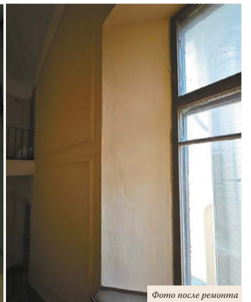
Фото после ремонта