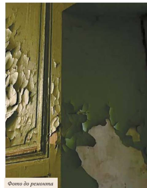
Фото до ремонта