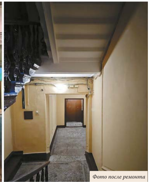
Фото после ремонта