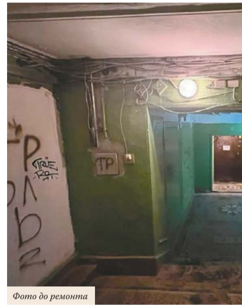
Фото до ремонта