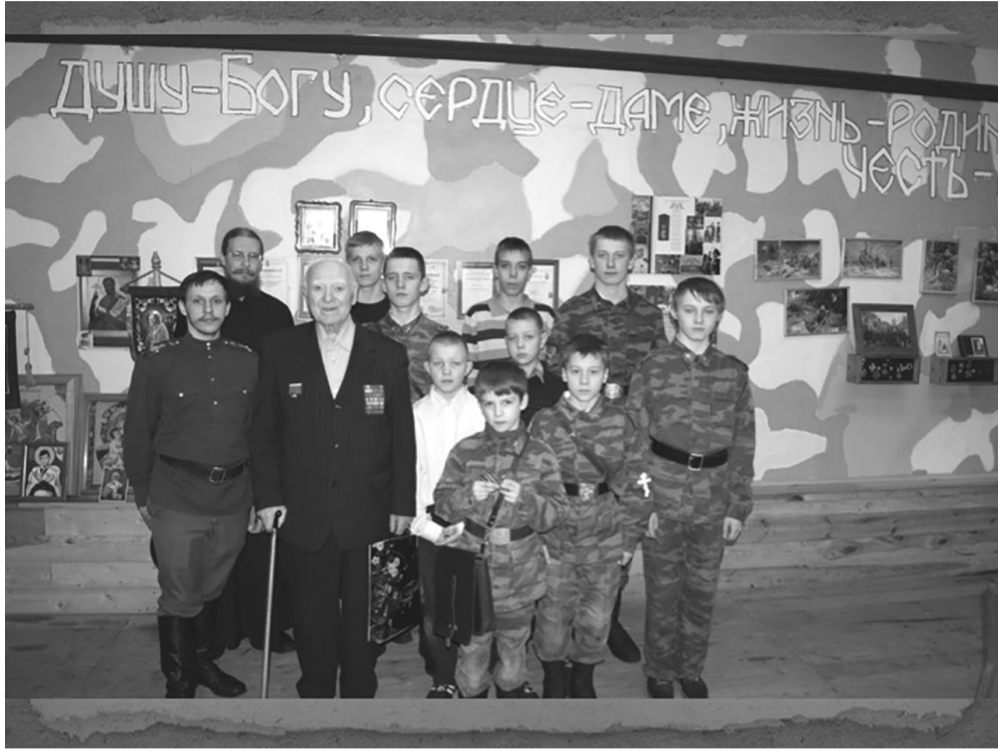
14 мая в зале с интерактивной выставкой «Они защищали Отечество» МО Владимирский округ, что в Графском переулке, 8, прошло мероприятие, посвящённое Дню Победы в Великой Отечественной войне.