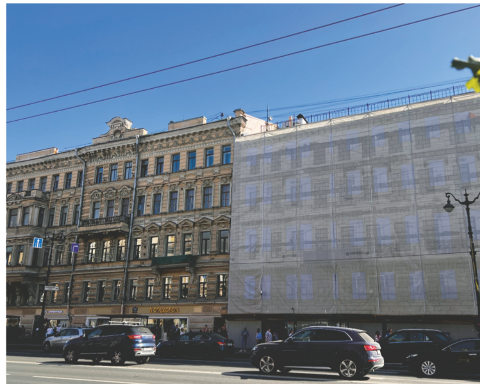
Фальшфасады на реставрируемых зданиях Невского проспекта выполняют и практическую, и эстетическую функции

Программу реставрации исторических зданий со сложным архитектурным убранством инициировал губернатор Александр Беглов. Это единственная подобная программа в России. Губернатор уже объявил о намерении продлить срок своих полномочий. Выборы главы города состоятся в сентябре 2024 года, а значит, у Александра Беглова будет шанс лично проконтролировать выполнение своей программы. Выборы губернатора впервые планируют провести по системе трехдневного голосования с 6 по 8 сентября; электронного голосования пока не предусмотрено, об этом сообщил председатель Законодательного собрания города Александр Бельский (по информации ТАСС от 29 марта 2024 года).