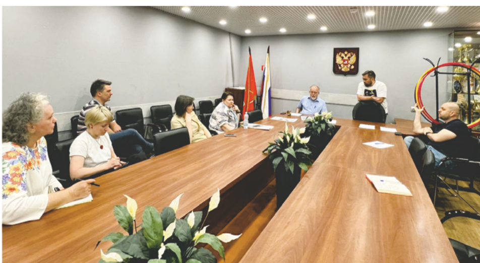
В округе каждый дом сталкивается с проблемой экскурсий по крышам