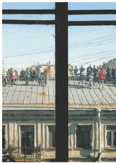
Картина в окне одного из домов на Загородном проспекте.

ков принять решение о запросе на установку камер видеонаблюдения. Далее – копию протокола собрания с решением отправить в администрацию Центрального района. После рассмотрения заявки комиссией по чрезвычайным ситуациям запрос отправят в Комитет по информатизации и связи, а затем – включат дом в адресную программу.