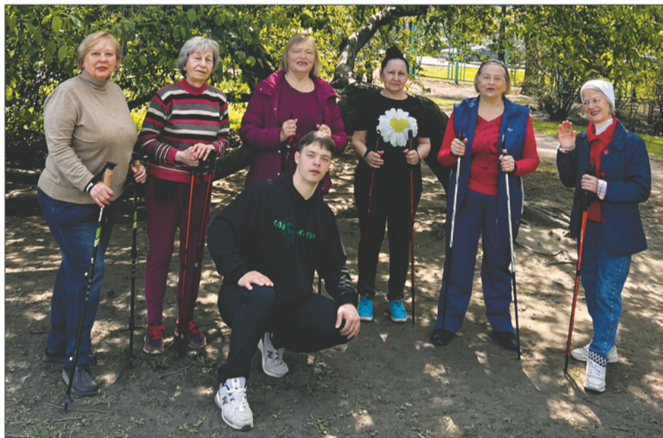
Фото на память о каждой тренировке. Мы это сделали!