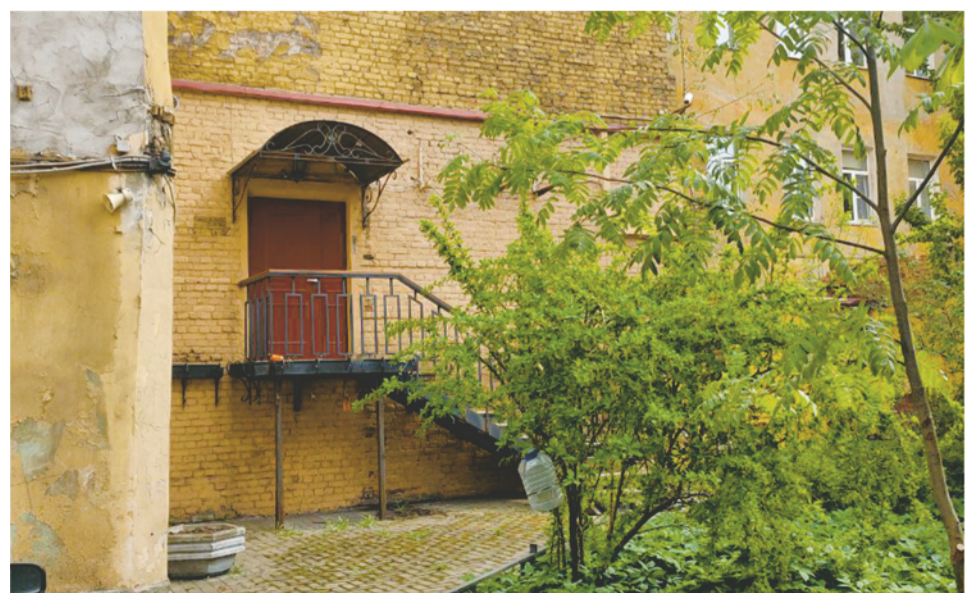
По решению суда хостел должен в том числе устранить самовольно организованные входы