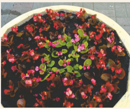
Красоту и радость - дворам и жителям округа