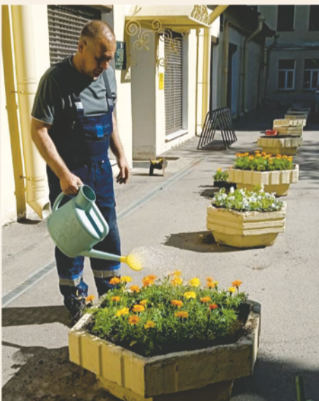
Мы стараемся создать красоту, будем рады вашей посильной помощи в ее сохранении