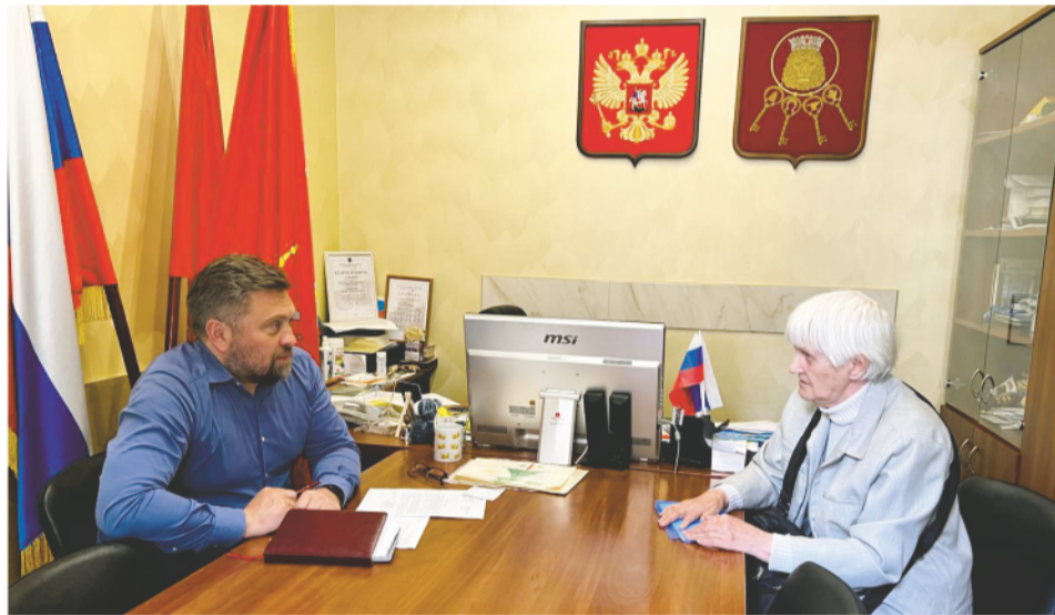
Вопросы от жителей могут касаться жизни всего округа, или только своего дома, или себя лично

Если у вас есть повод и необходимость обратиться за консультацией или помощью в муниципалитет, записывайтесь на единый день приемов по телефону 713-27-88 прямо сейчас.