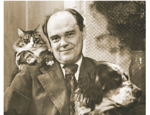
Евгений Иванович Чарушин

шет книжки для самых маленьких о природе – игровые, познавательные, книжки-картинки, для тех, кто только начинает читать и может по картинкам сочинить историю. Ее истории разыгрывают в детских садах. Я же обратилась к рассказам. Это, наверное, мне передалось от прадедушки, помимо имени. После каждого путешествия возвращаюсь с желанием показать в рассказах и иллюстрациях свое отношение, впечатления и эмоции от увиденного.