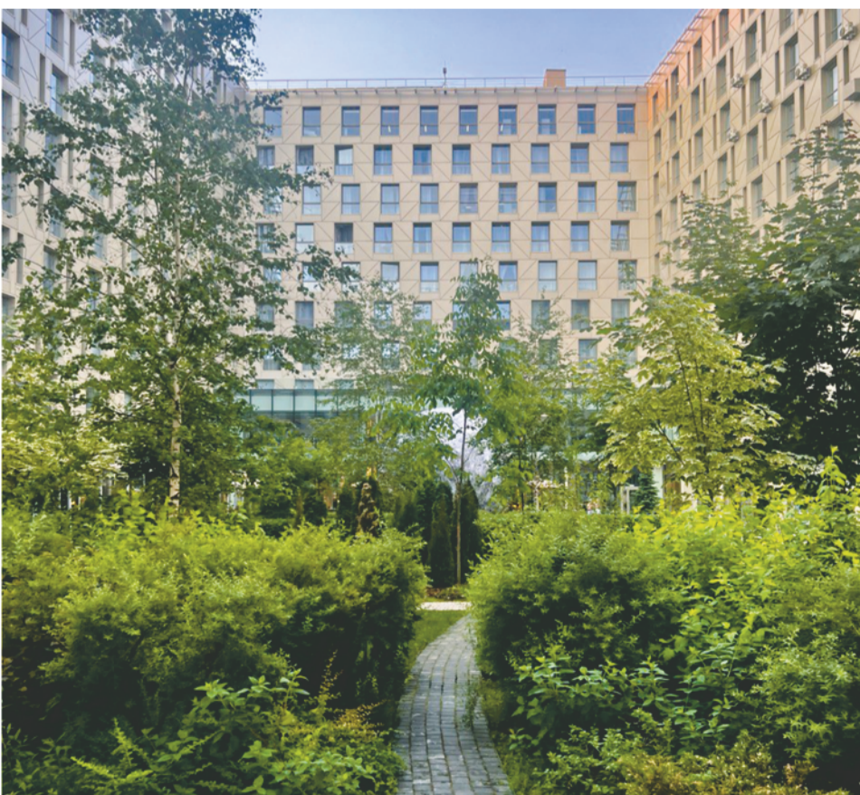
Добросовестные апарт-отели привносят в жизнь округа благоустройство, комфорт и эстетику