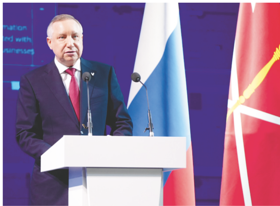
Губернатор Александр Беглов инициировал единственную в России программу по реставрации исторических жилых домов со сложным архитектурным убранством.

в середине февраля 1897 г. под руководством Ленина Владимира Ильича состоялось совещание членов петербургского «Союза борьбы за освобождение рабочего класса» (Пушкинская ул., 1/77).