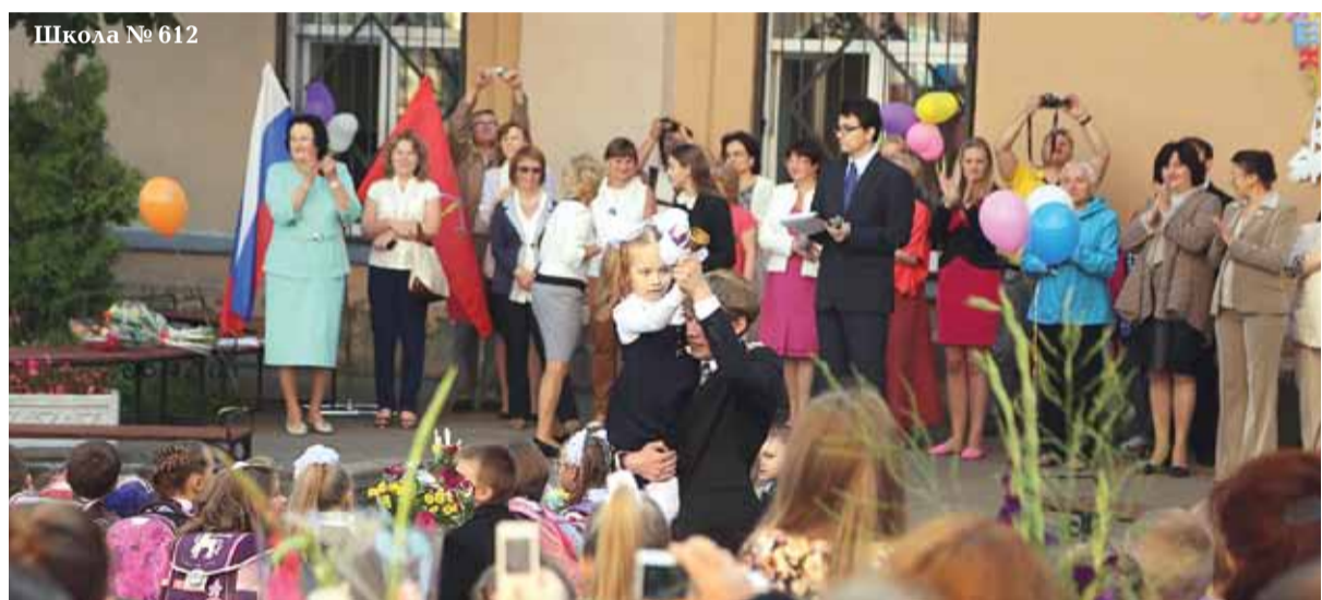
Школа № 612

Во Владимирском округе их много. Имеются они на Разъезжей и Коломенской улицах, в Свечном