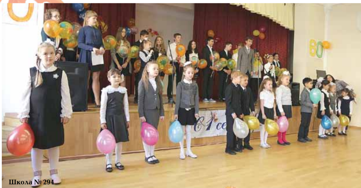
Школа № 294

переулке. Как правило, собственных территорий для прогулок у детских садов нет, поэтому мы очень благодарны всем главам муниципальных образований района за поддержку в хорошем состоянии оборудования и территорий всех дворовых детских площадок, куда выходят гулять воспитанники детских садов.