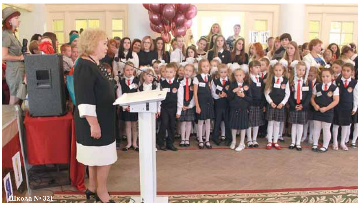
Школа № 321