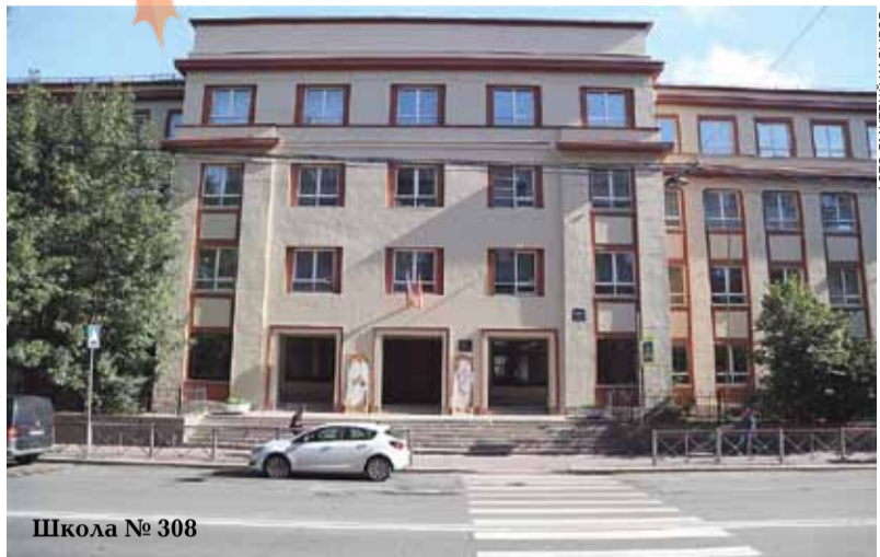
Школа № 308