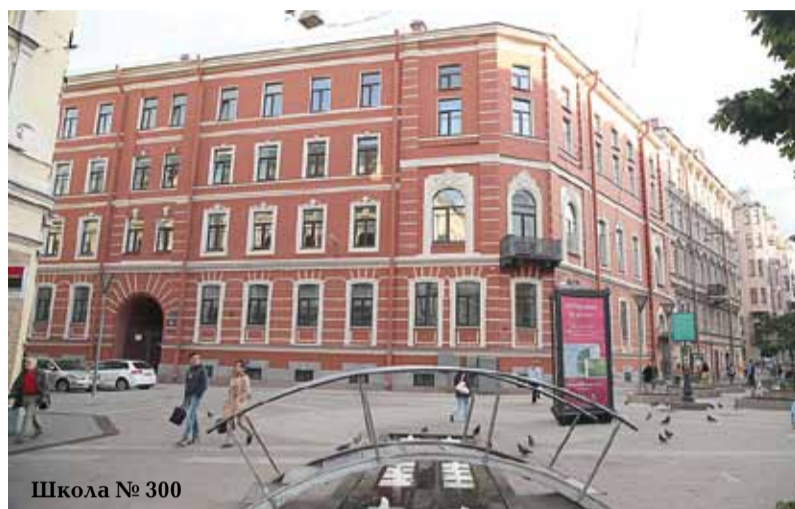
Школа № 300

этом смысле тоже готовы к приёму детей и началу учебного процесса.