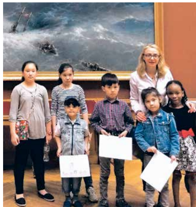
На каникулах дети ходят с волонтерами в музей, после рассказа о картинах — рисуют

Наши волонтеры — люди разных национальностей и разных профессий, объединённые любовью к детям и пониманием поставленной задачи: помочь мигрантам и помочь городу, городским школам, городским учителям. Так что приглашаю всех, у кого есть время и желание, присоединиться к нашей команде.