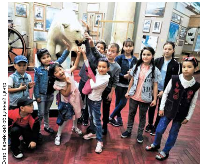
Бессменная звезда музея Арктики и Антарктики