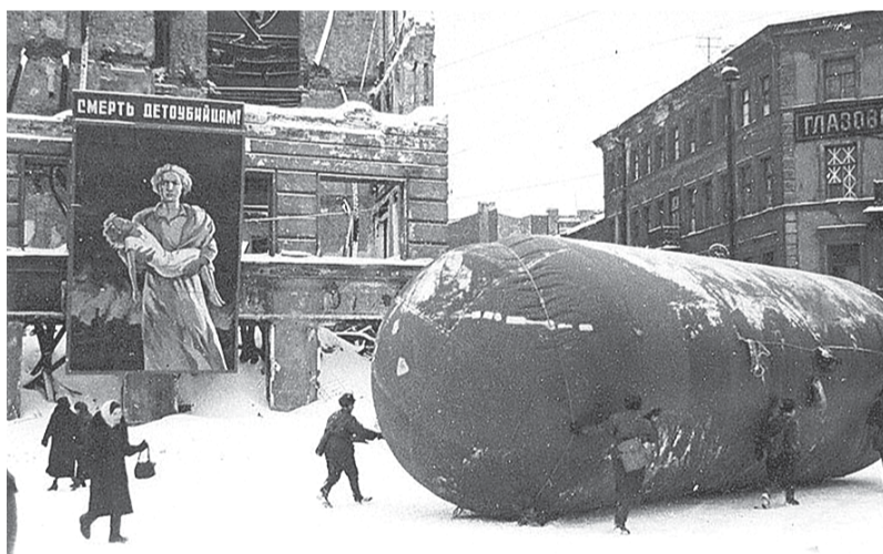
Транспортировка газгольдера на углу Лиговского проспекта и Разъезжей улицы. 1943