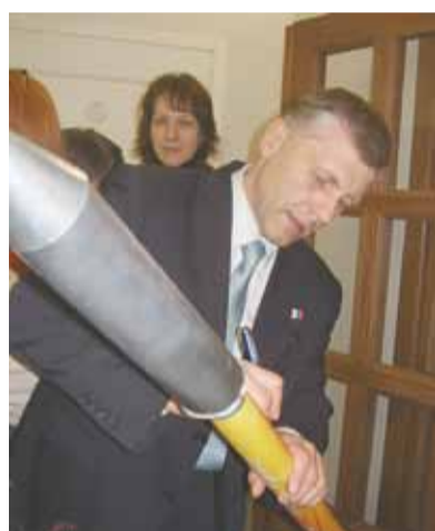
Герой России, космонавт А. И. Борисенко

— К чести американских астронавтов, они умеют строить доброжелательные отношения, поэтому политика отходит на задний план, так как всё подчинено общей задаче, которую мы выполняем в космосе. Ведь чем хорош международный космический проект? Люди, которые участвуют в нём, нацелены на общий результат, на выполнение научных экспериментов, при серьёзном понимании того, что в условиях космоса, если что-то случается, либо выживают все, либо не выживает никто. Все нацелены на конечный результат, выполняют единую программу на основе задач, поставленных перед каждым членом экипажа. Понимание этого присутствует у всех наших партнёров, поэтому работаем единым коллективом и выполняем единую программу.