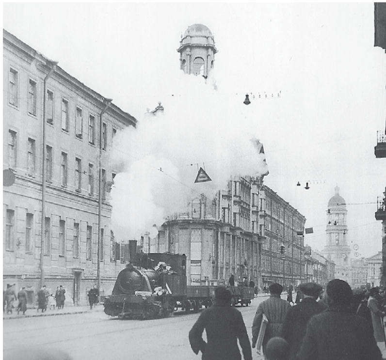
Блокада. Паровоз на трамвайных рельсах на Загородном проспекте. Октябрь, 1942