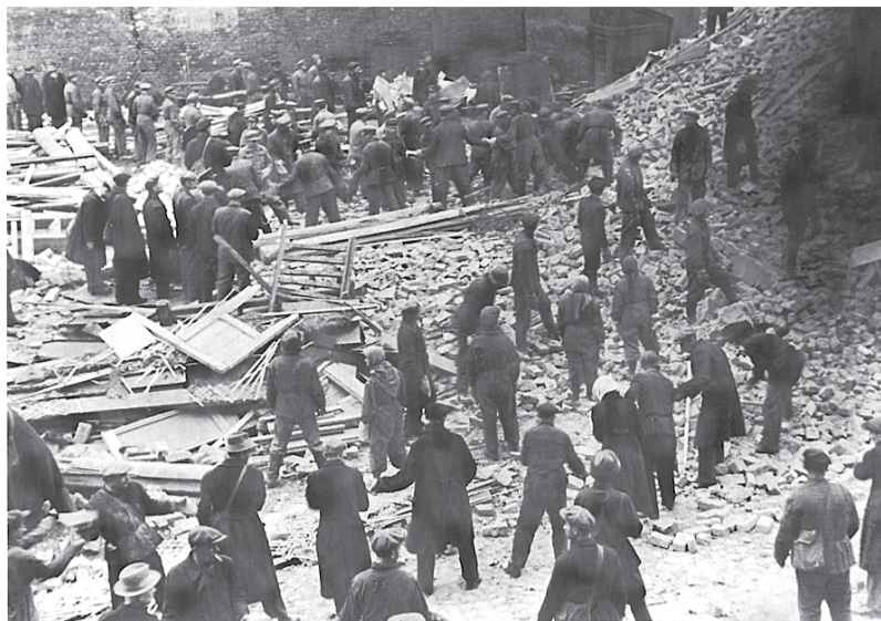
Разбор завалов после бомбёжки. Дмитровский пер., дом 4