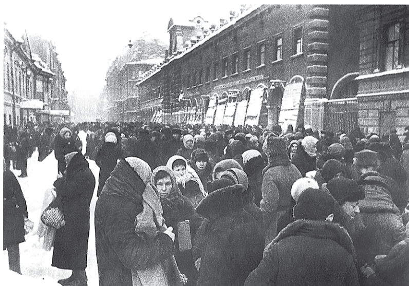
Толкучка у Кузнечного рынка в блокадном Ленинграде. Зима 1941-1942