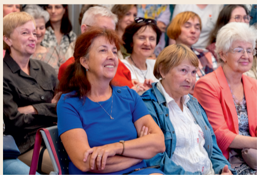
Очень тепло встречали артистов