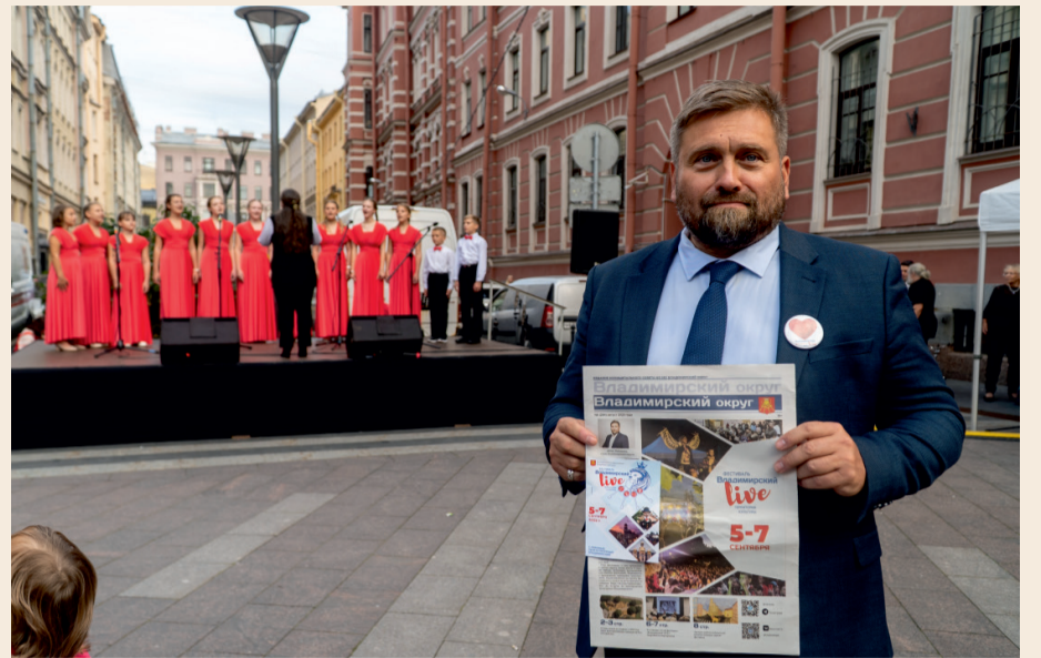
За 4 сезона фестиваль превратился в культурный бренд центра