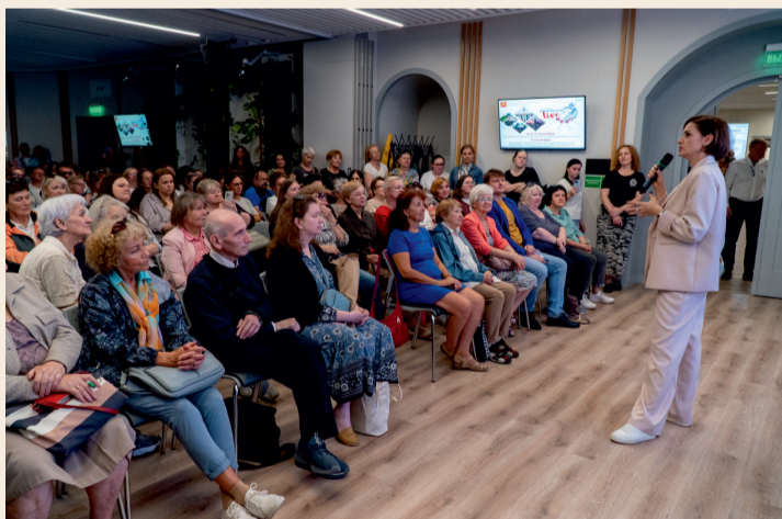
Аншлаг на творческой встрече с актрисой Анной Ковальчук