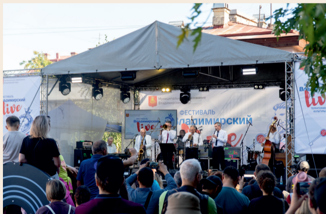
Джаз в обновленном Джазовом сквере