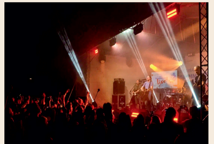
Группа «Калинов Мост» - яркое завершение фестиваля