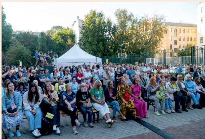
В Джазовом сквере фестивальное настроение