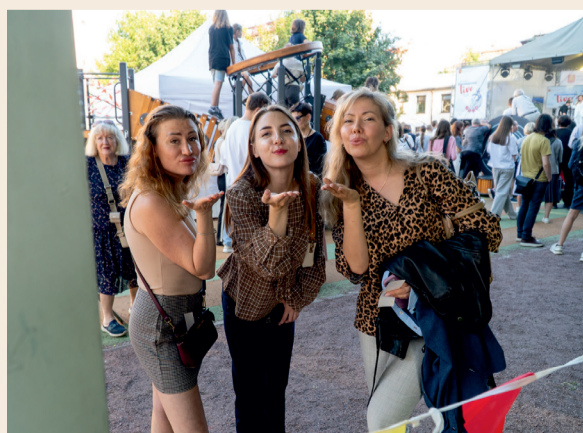
Ваши памятные снимки