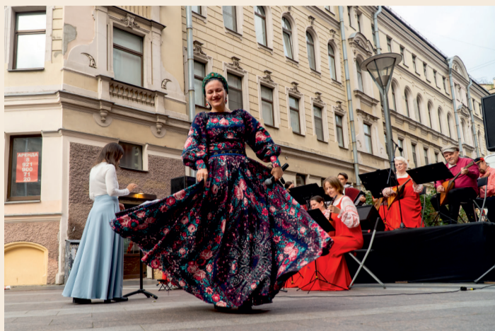
Открытие фестиваля на сцене на ул. Большая Московская

Фестиваль стал трёхдневным марафоном, где классика встречалась с роком, история — с современностью, уличный концерт — с камерным спектаклем. Но главное — в очередной раз мы смогли убедиться: чтобы отправиться в мир культуры и искусства, нам достаточно выйти из парадных. География событий охватила весь округ, превратив его в единое культурное пространство, где за каждым углом ждало новое открытие.