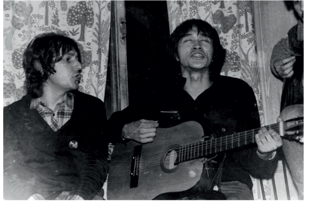
С Виктором Цоем в комнате Майка на ул. Боровой

неловко, но раз так, надо ответить... Насколько я знаю из разговоров с очень многими музыкантами из разных групп и разных городов: какое-то влияние я оказал в том плане, что может быть, одним из первых стал писать очень конкретные песни тем языком, которым мы общаемся друг с другом, простыми обычными словами