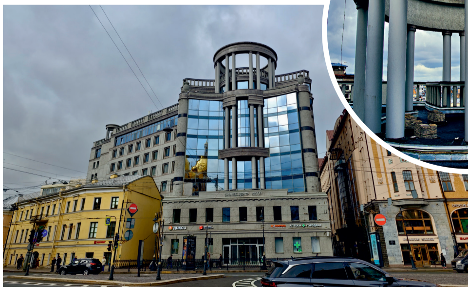
Проект капрома во Владимирском округе.