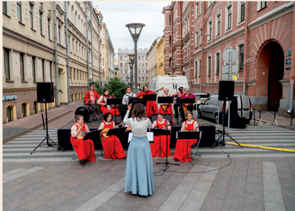
Ансамбль «Русская песня» при Владимирском соборе - постоянные участники фестиваля