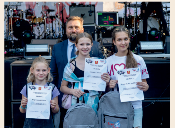
Награждение самых активных детей округа - обязательная церемония фестиваля