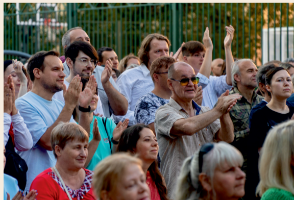
Пели, радовались и праздновали жизнь всем округом