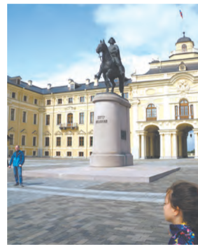
Памятник Петру I

Здесь же находится и коллекция произведений русского искусства XVII-XIX веков, собранная и переданная в дар дворцу знаменитыми музыкантами М. Л. Ростроповичем и Г. П. Вишневской, а также хранятся полотна Боровиковского, Брюллова, Иванова, Айвазовского, Коровина, Рериха, Билибина, Репина, Григорьева и других русских художников. Самым ценным приобретением дворца является коллекция изделий из фарфора от елизаветинской эпохи до советского времени. В Нижнем парке