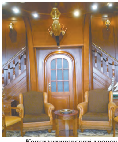
Константиновский дворец. Зал Бельведер