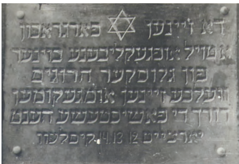
Надпись на памятнике в г. Глуске