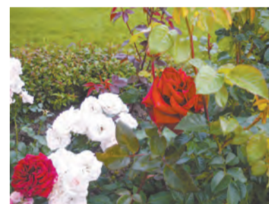
Розы в парке