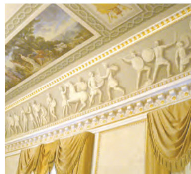
Константиновский дворец. Троицкий зал

России под инициалами «К. Р.» (Константин Романов).