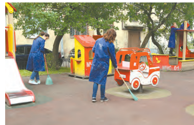
Трудовой отряд за работой

Скажу вам честно, без затей, Работать вместе веселей, В бригаде я нашла друзей, Они мне скрасят серость дней.