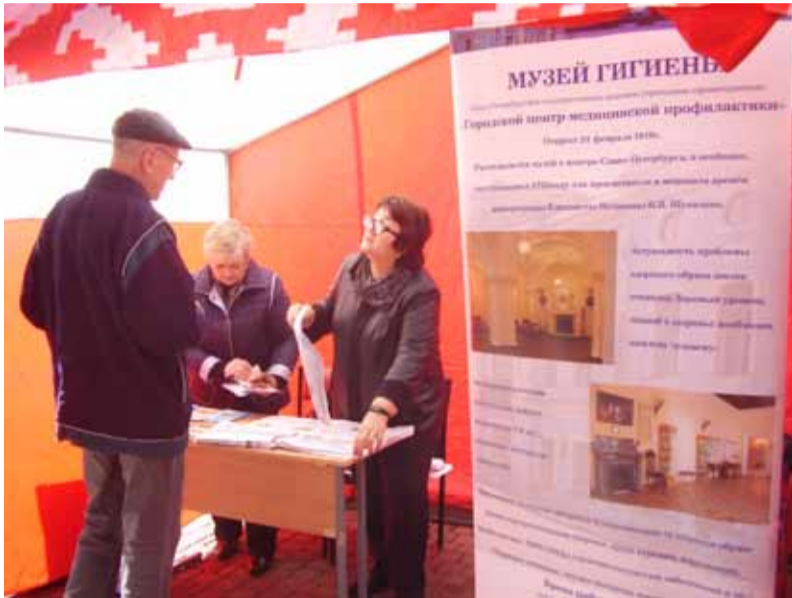
(Окончание. Начало на стр. 1)

А также — регулярно посещать Центр здоровья, чтобы наблюдать свои показатели: артериальное давление, уровень глюкозы, массу тела, а с врачами обязательно раз-