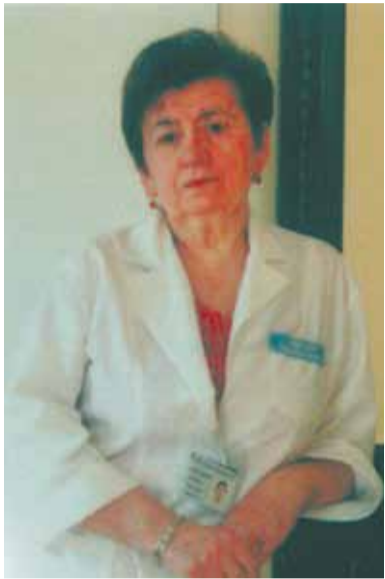
В прошлом году этому учреждению исполнилось 80 лет. Это

По окончании Курского государственного медицинского института получила распределение в Ленинград. Работала в женской консультации Сосновой Поляны. 45 лет трудится в ЛПУ Родильный дом № 2 на Фурштатской улице, 36, Центрального района по специальности акушер-гинеколог. Из них 15 лет — главврачом.