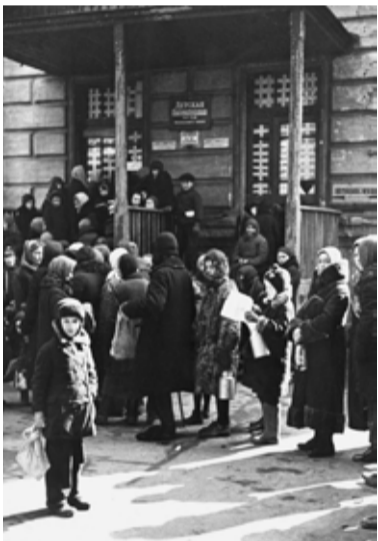
Во дворе Поликлиники № 37 (ул. Правды, 18) стоит очередь за молоком. 1942 г.