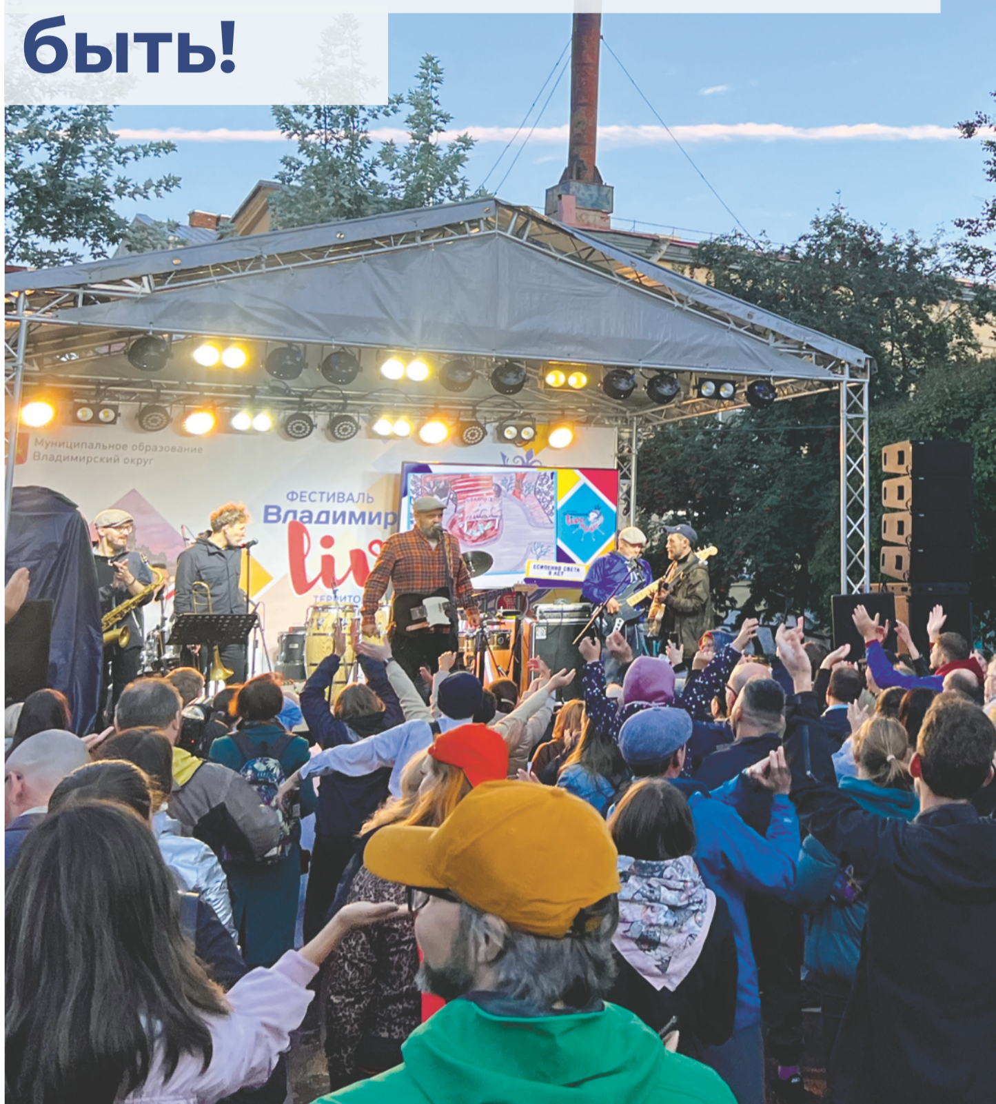
О том, как к главному событию в культурной жизни округа готовятся участники