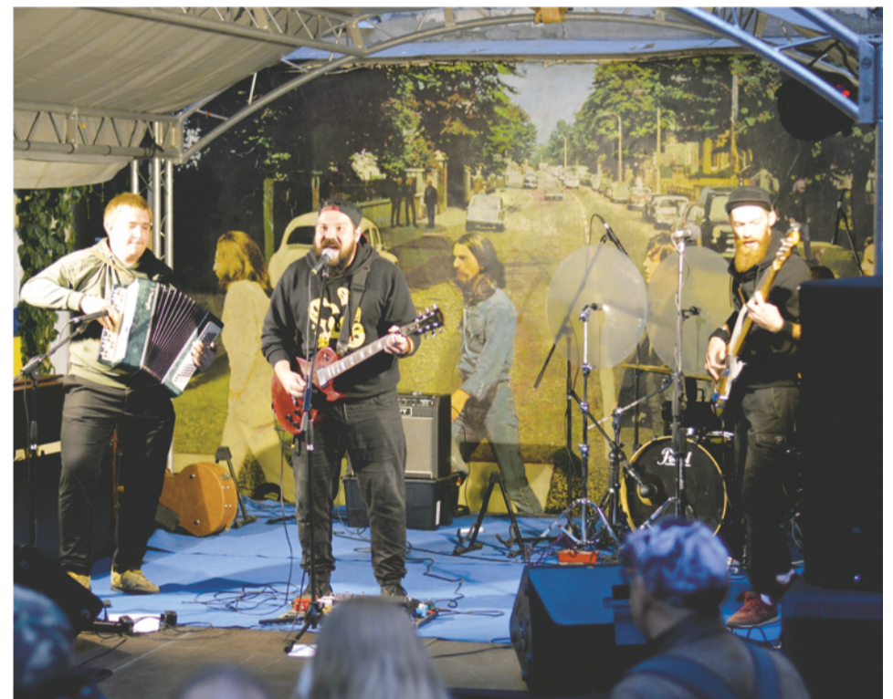
Изображение на стене во дворе арт-центра «Пушкинская-10» украшает сцену рок-концерта фестиваля «Владимирский LIVE»