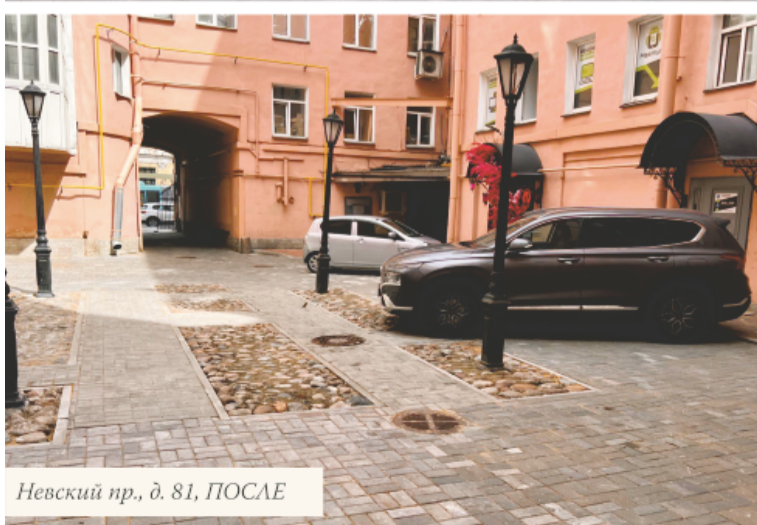
Невский пр., д. 81, ПОСЛЕ