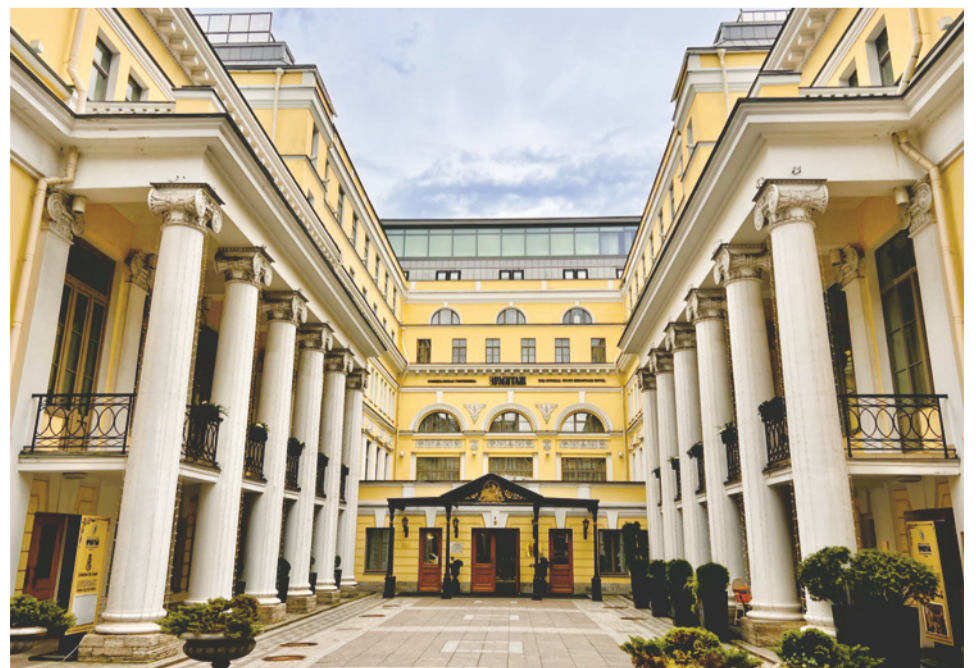
Гостиница Государственного Эрмитажа, наши дни