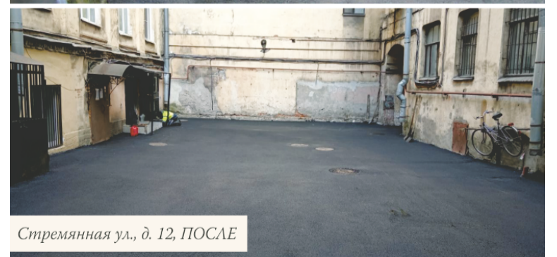
Стремянная ул., д. 12, ПОСЛЕ