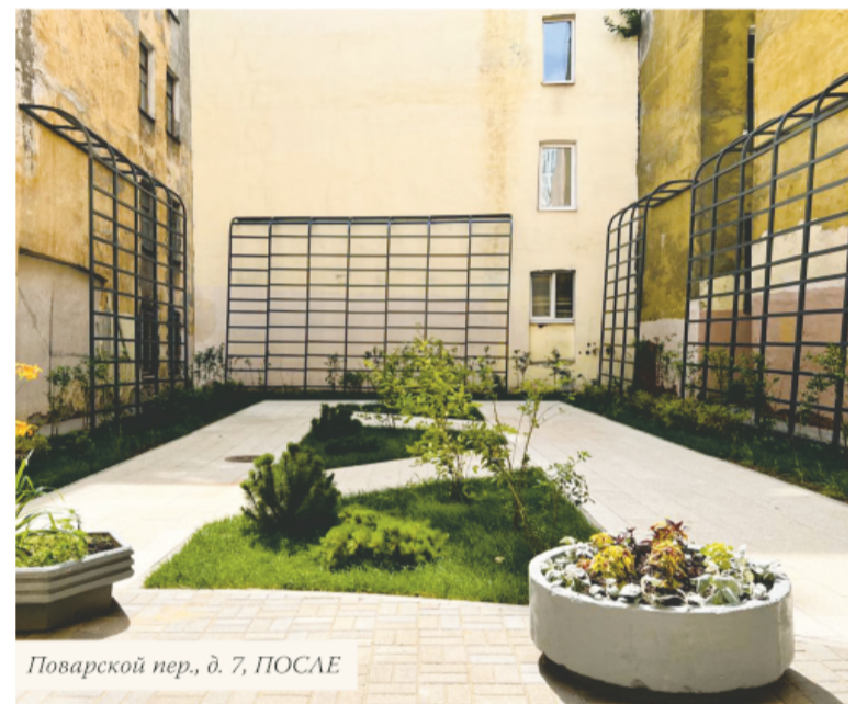
Поварской пер., д. 7, ПОСЛЕ

ми натурального камня) было сильно изношено, имело провалы и неровности.