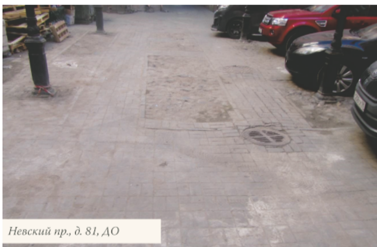
Невский пр., д. 81, ДО