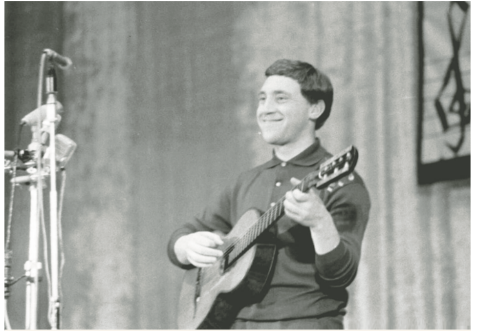
Дебютное выступление В. Высоцкого в клубе «Восток» (ДК Пищевиков) 18 января 1967 года

В 1967 году в клубе, как утверждает-ся на его сайте, дал первое официальное публичное выступление Владимир Высоцкий. Активно сотрудничали с «Востоком» петербургские артисты Александр Городницкий и Александр Дольский, приезжали на гастроли главные популяризаторы авторской песни на радио и в кино - москвичи Юрий Визбор и Сергей Никитин; так главными звездами клуба стали авторы-исполнители 1930-х годов рождения - представители поколения «шестидесятников». Но даже если отбросить успехи отдельных членов, клуб «Восток» долгие десятилетия развивал и до сих пор продолжает