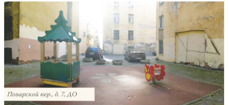
Поварской пер., д. 7, ДО

Во дворе дома 81 на Невском проспекте ДО благоустройства покрытие двора (тротуарная плитка серого и красного цветов с островка-