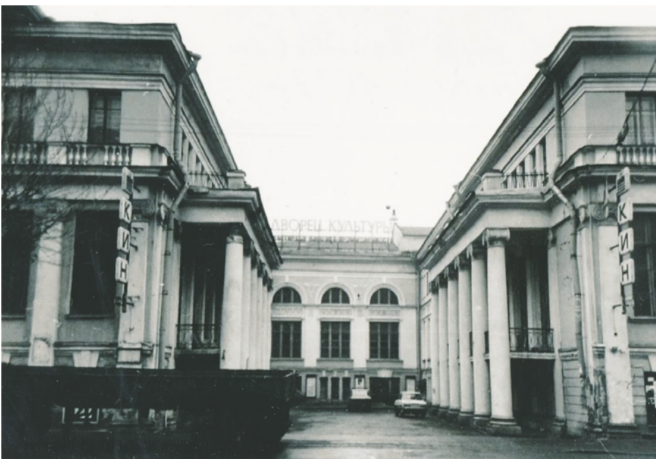
ДК Пищевиков. Фото Андрей Агафонов, 1995 г.