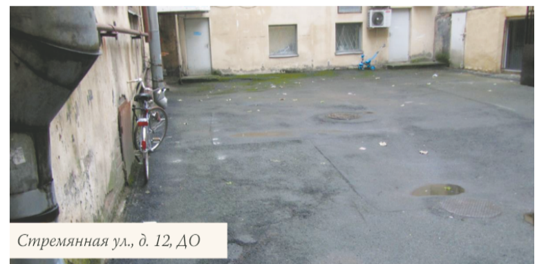
Стремянная ул., д. 12, ДО