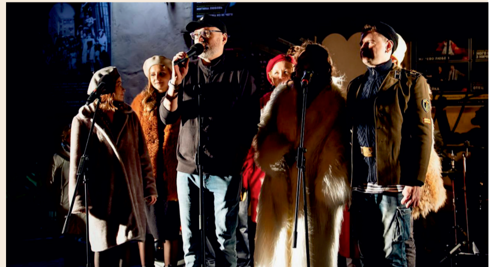
Концерт театра «Суббота» во дворе на первом фестивале «Владимирский LIVE»

- У «Субботы» много театров по соседству, в том числе очень больших, боитесь ли вы конкуренции?