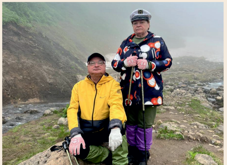
Камчатка, август 2025 года

Так история, начавшаяся с двух подписей, приобрела новое измерение, каждый следующий год которого добавлял свои краски: от студенческой романтики к дачным грибным сезонам, рабочим кабинетам, музейным маршрутам. А с появлением внучки эта культурная традиция получила продолжение: в репертуаре появились ТЮЗ, Karlsson Haus, детская художественная школа.