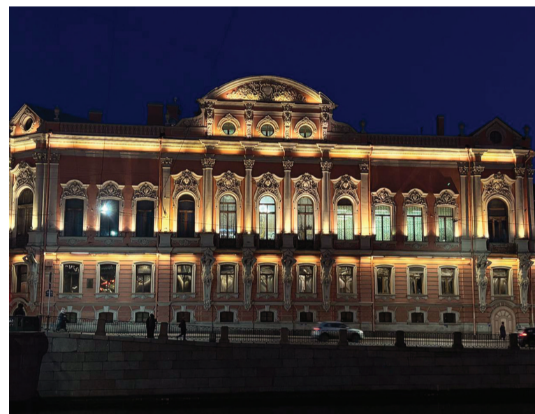
Дворец Белосельских-Белозерских — розовая жемчужина Невского проспекта