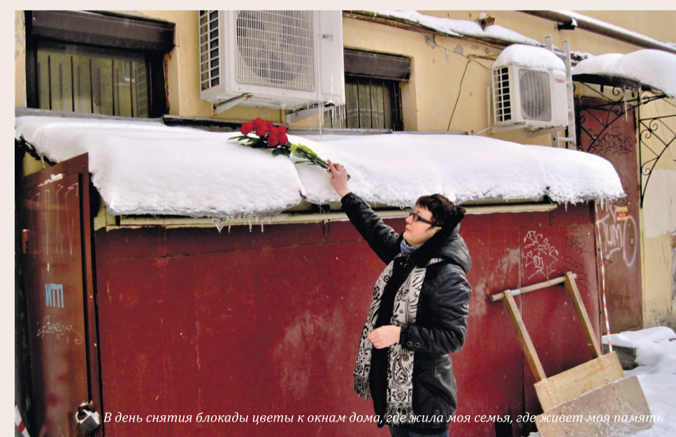
В день снятия блокады цветы к окнам дома, где жила её семья, где жила её семья

«Я детство на Лиговке отчётливо помню с 3-летнего возраста. Помню, как по длинному коридору в коляске без колёс мой брат и соседский мальчишка меня возили. Самое яркое воспоминание, как на общей огромной кухне, видно перед расселением, появилась новая мебель — беленькие шкафчики. И мы в эти шкафчики залезали, играли в прятки. Есть