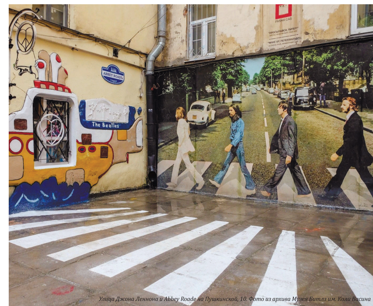
Улица Джона Леннона и Abbey Road на Пушкинской, 10.