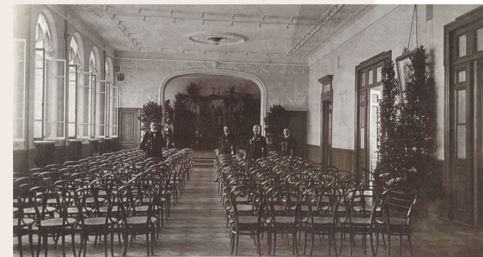
Здание гимназии и реального училища Г. К. Штемберга. Актовый зал. Фотография 1913 г.

А. В. Козлов, Б. М. Кириков «Сильвио Данини: материалы к творческой биографии» (Коло, 2017). www.citywalls.ru