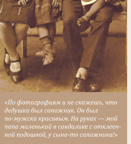
«По фотографии и не скажешь, что дедушка был сапожник. Он был по-мужски красивым. На руках — мой папа маленький в сандалике с отклеенной подошвой, у сына-то сапожника!»