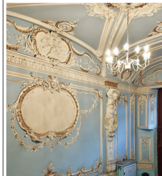
Обособняк Каншина — Кузнечный переулок, дом 6.

Обособняк — покупка Василия Каншина. В Кузнечном переулке он приобрёл ещё несколько домов для своих детей: под номером два — для сына, под номером четыре — для дочерей.