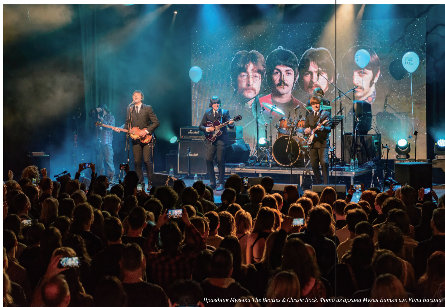
Праздник музыки The Beatles & Classic Rock.