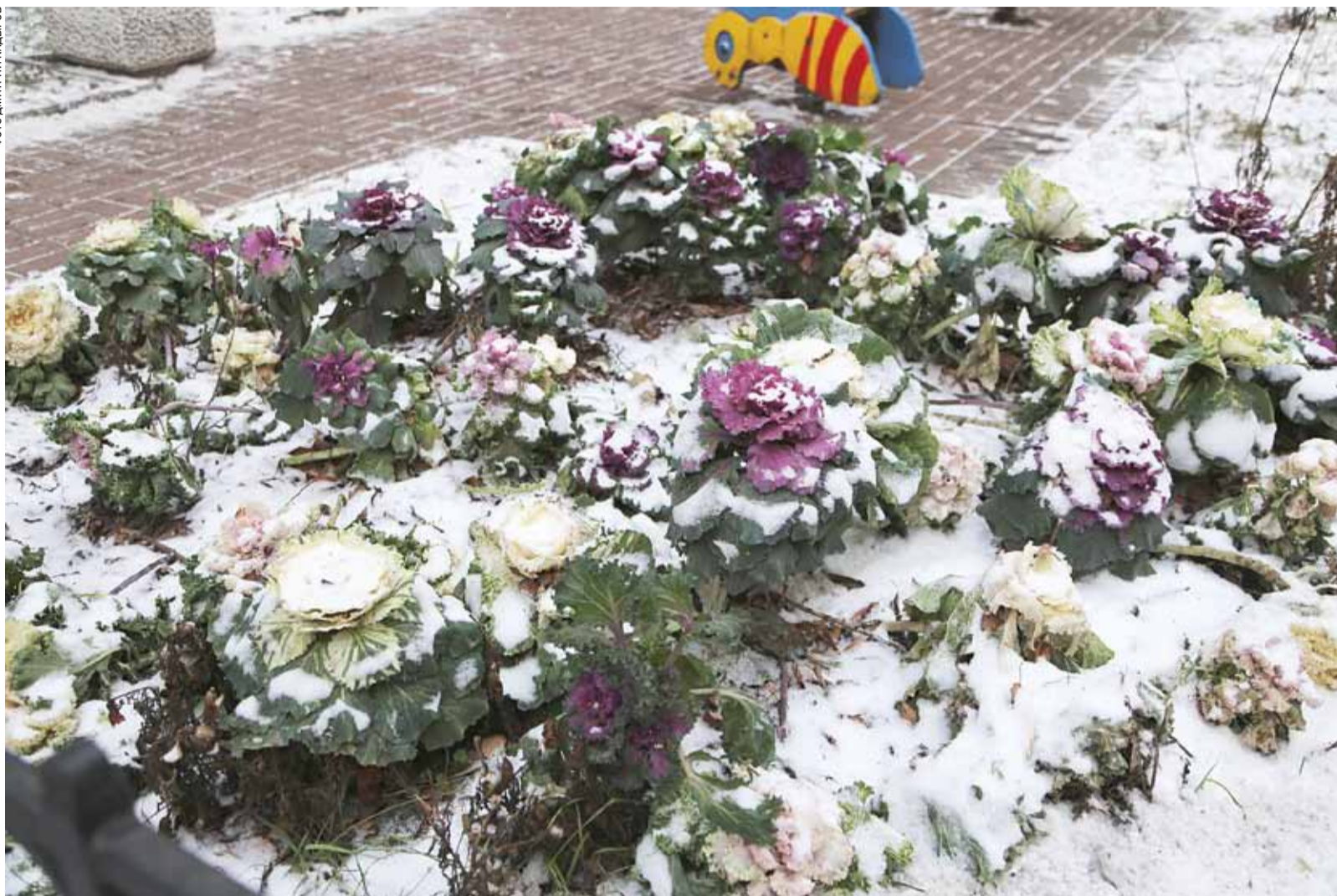
Цветы в январе. Двор дома 12 на улице Правды