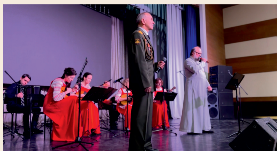
Ансамбль «Русская песня» 15 лет

- Я для своего ребенка тоже хочу добра, мира и света. Мы всей семьей в храме каждое воскресенье, и в дни Праздников церковных. Это естественно. Дети не меньше взрослых, а может быть и больше откликаются душой. И детская молитва – особенная. С другой стороны, как правило, если оставить некрещеным, 99,9% человек не приходит к Богу, а тем более, напившись подросткового яда – интернет, игры, улица. Мы со старшими детьми тоже обсуждали это, я говорил, что они часто время тратят попусту. Но, конечно, есть время на безумство молодежное, потом – на зрелость. Я веду молодежный клуб собора, много с молодежью общаюсь – от 17 до 40 лет. Каждое воскресенье в 15:00 мы встречаемся в соборе, пьем чай, раз-