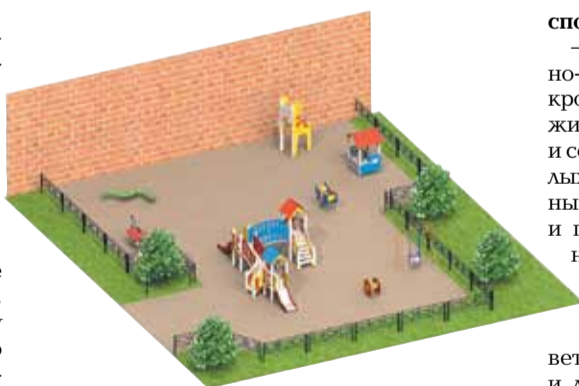
Макет детской площадки. Коломенская ул., 8

Приглашаем и жителей округа принять участие в Дне благоустройства — 23 апреля. Депутаты Муниципального Совета и служащие также примут участие в месячнике благоустройства. Во время субботников будет