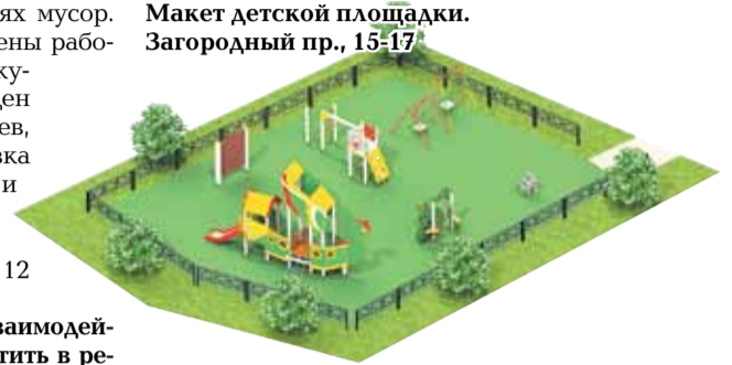
Макет детской площадки. Загородный пр., 15-17

— О решении проблемы с вывозом мусора что могли бы рассказать?