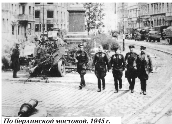
По берлинской мостовой. 1945 г.