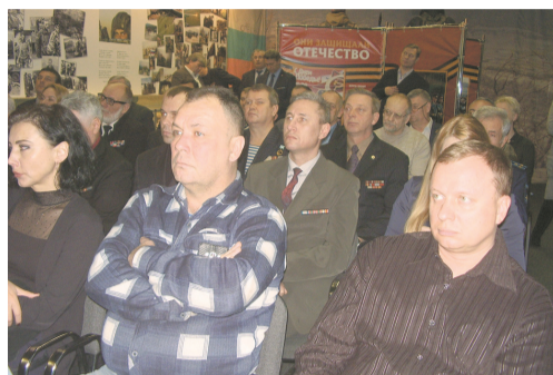
В зале выставки «Они защищали Отечество»