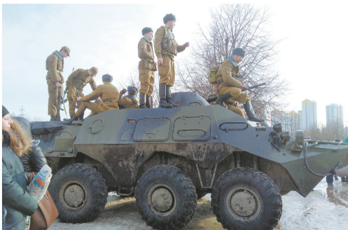
Бронетранспортёр в парке Интернационалистов на пр. Славы