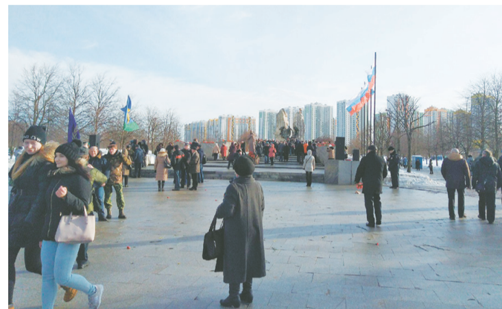
Парк Интернационалистов на пр. Славы