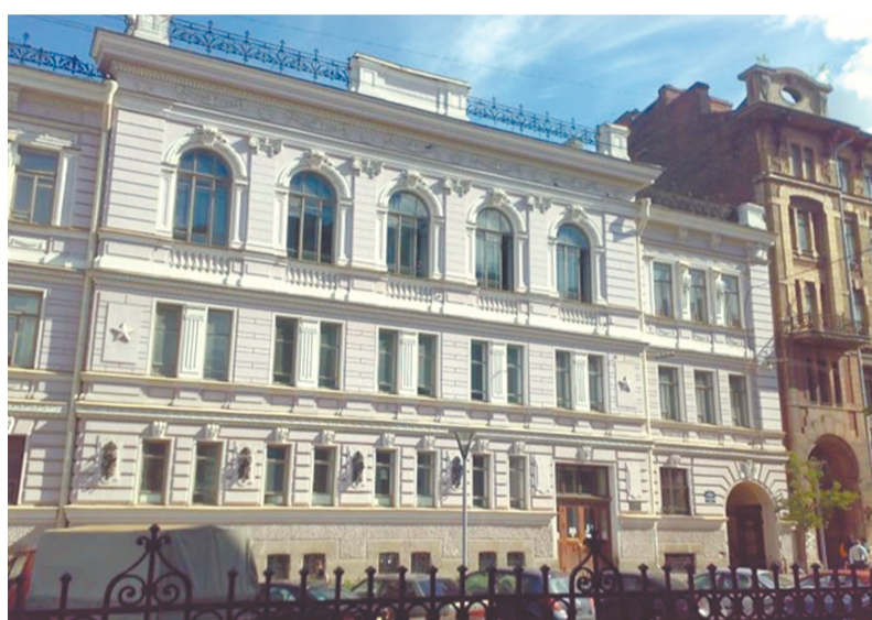
Поликлиника № 37

Петербург был поделён на участки по числу думских врачей, которые принимали у себя на дому и вели квартирные обходы больных.