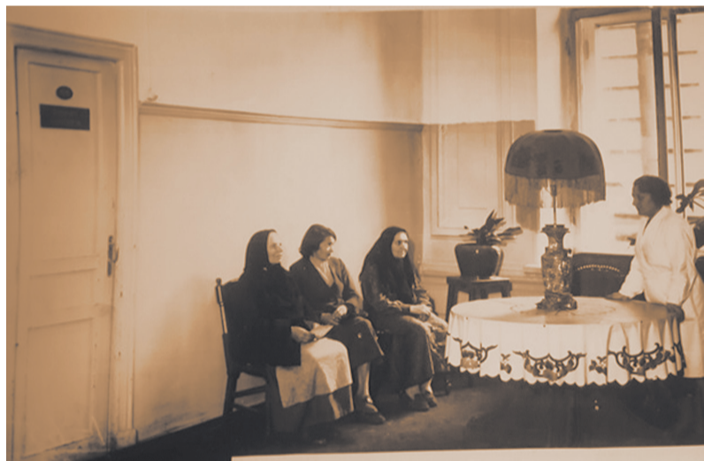
Ожидание приема врача. 1939 г.