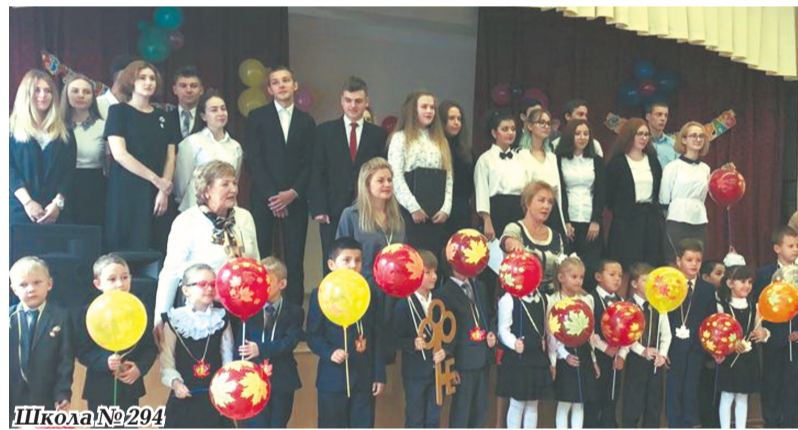
Школа № 294