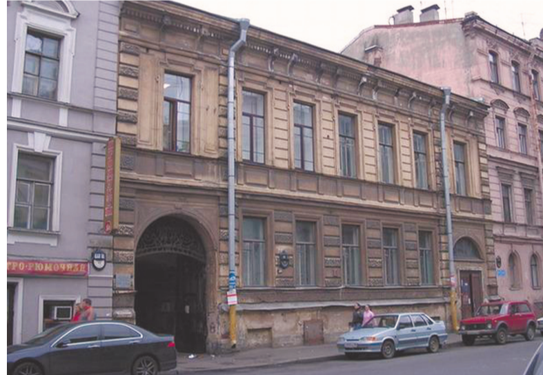
Развезжая улица, дом № 9