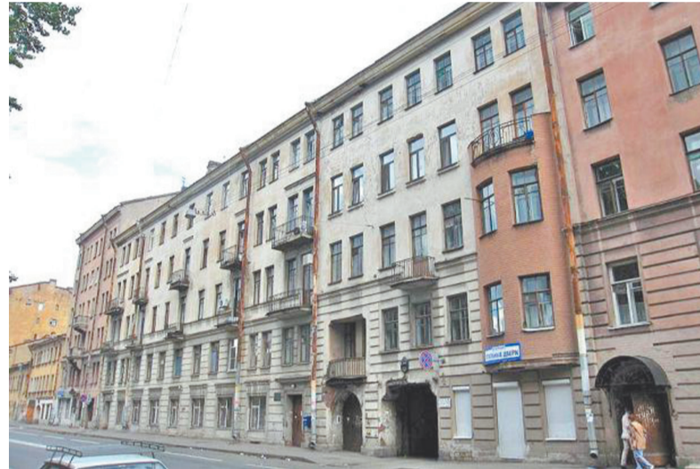
Боровая улица, дом № 26