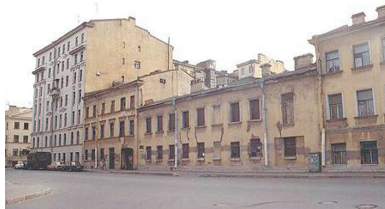
Боровая улица, дом № 20