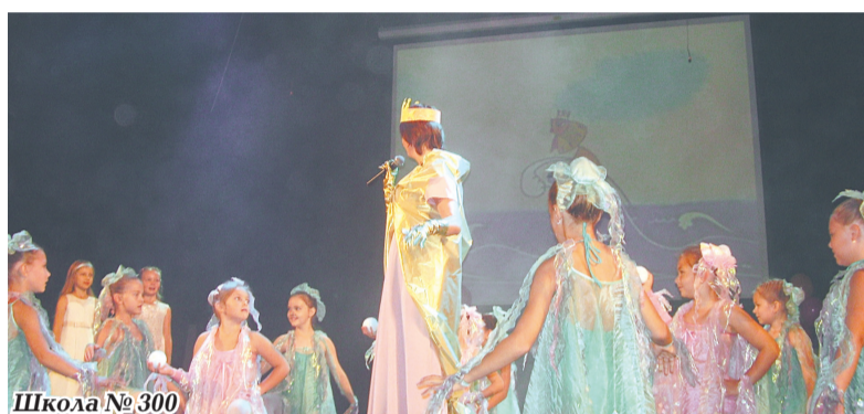
Школа № 300

того, он посещает занятия спортивной гимнастикой, увлекается большим теннисом, шахматами, плаванием, кавказскими танцами, любит собирать «Лего».