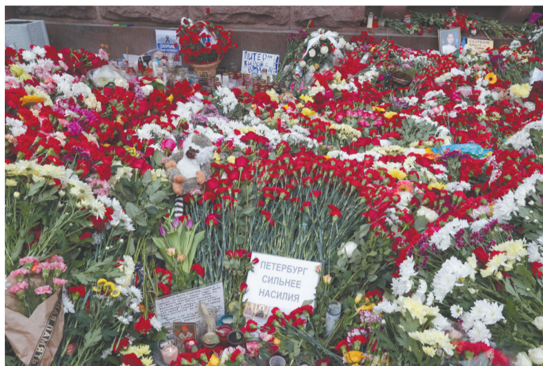
Возложение цветов у станции метро «Технологический институт», апрель 2017 г.

Поэтому, помянув невинных жертв, мы едины в своем намерении всеми силами противостоять террору. Бдительность, ответственность каждого из нас составляют арсенал анти-