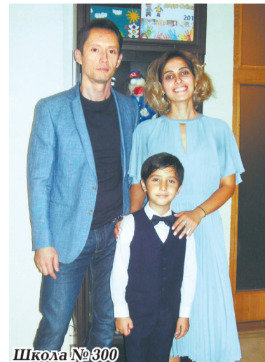
Школа № 300