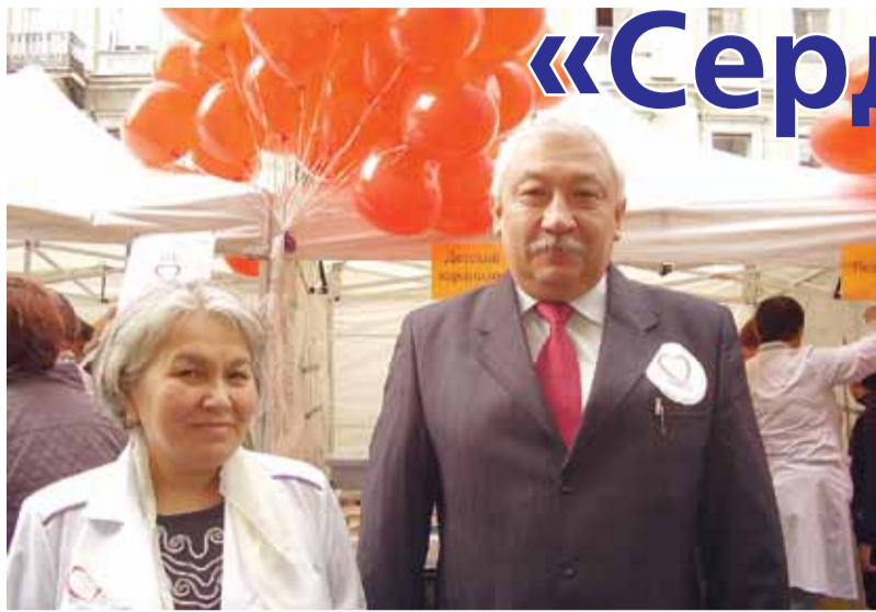
25 сентября жители и гости нашего Владимирского округа празднично чествовали Сердце Человека — живое, оптимистичное, умеющее радоваться и горевать, надеяться и любить. Сердце — в гармонии с духовным и практическим началом, заложенным в каждом из нас.