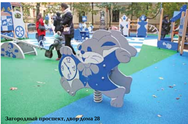
Загородный проспект, двор дома 28

и установлено игровое оборудование для обучения детей Правилам дорожного движения. По обоим адресам произведена замена искусственного покрытия. Заключительные работы будут произведены до 30 октября 2015 года.