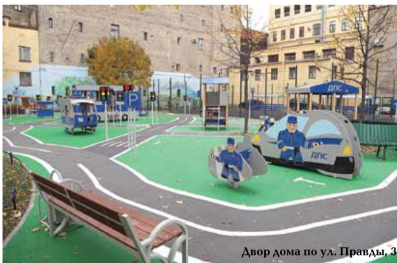
Двор дома по ул. Правды, 3